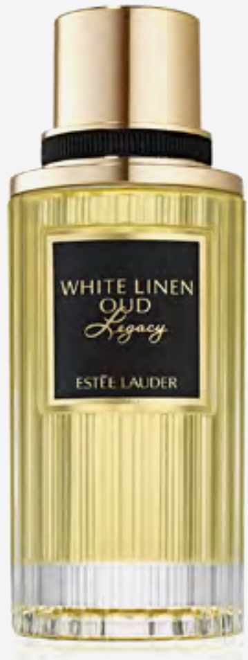
عطر وايت لينين عود ليغاسي AED 1160