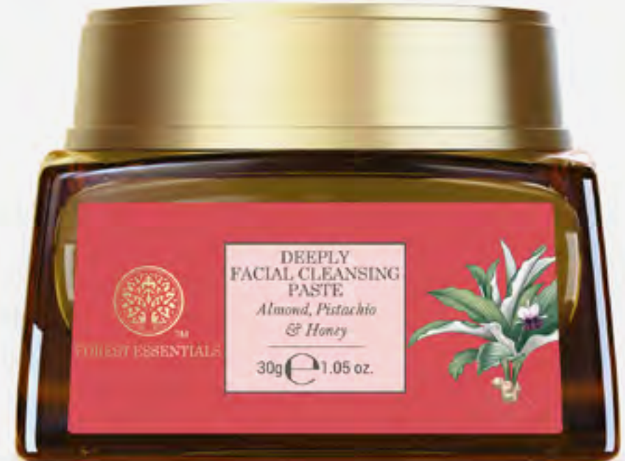
لوز منظف عميق للوجه 30 غ AED 125