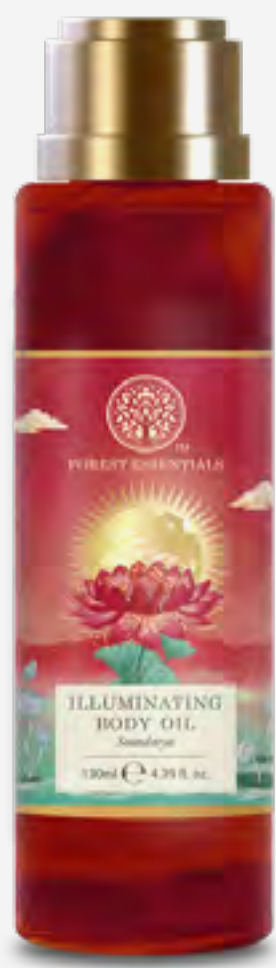
زيت جسم إلومينيتينغ ملمع 130 مل AED 120