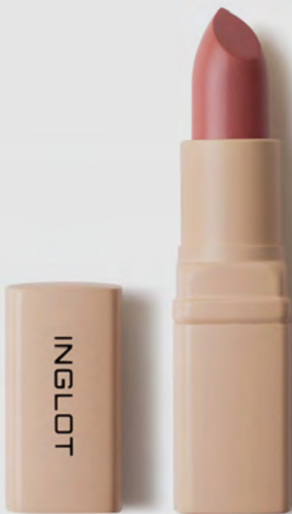
أحمر شفاه كريمي ناعم AED 95