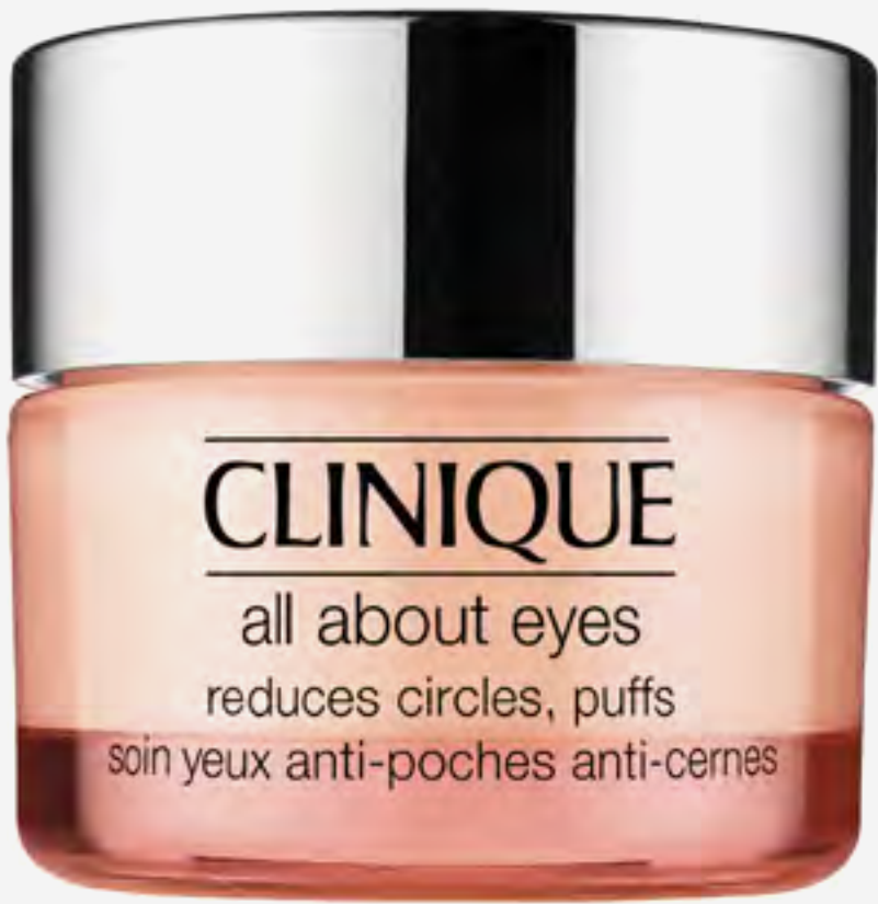
كريم عيون أول أبوت آيز 30 مل AED 280