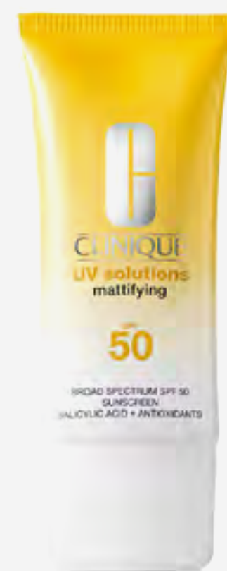
واقى شمس يو في سوليوشنز مطفي عامل حماية +50 40 مل AED 152