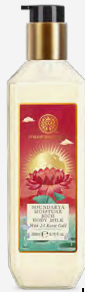
حليب جسم سونداريا مرطب غني بذهب عيار 24 200 مل AED 150