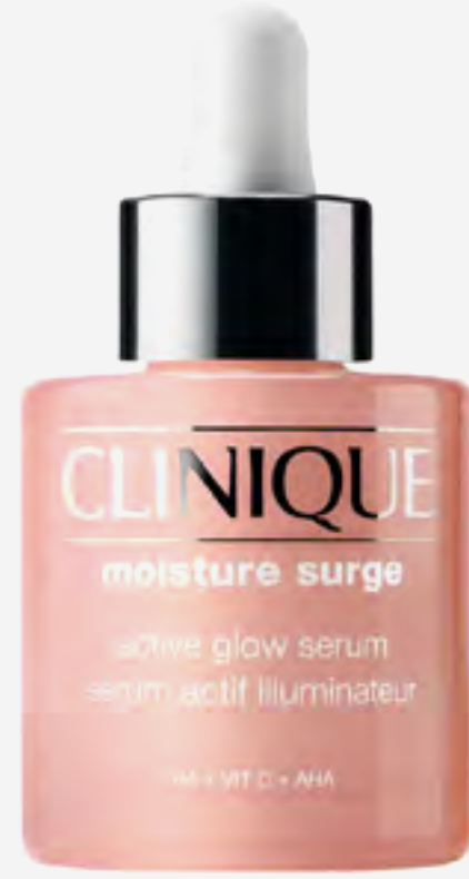
سيروم مويستشر سيرج أكتيف غلو المرطب 30 مل AED 250