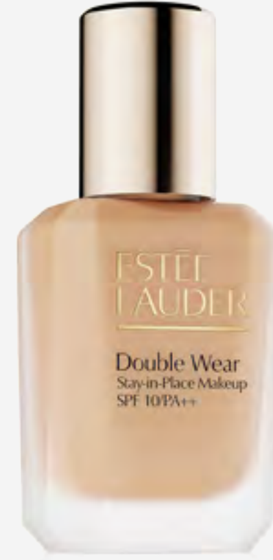
فاونديشن دبل وير ستاي إن بليس ثابت AED 235