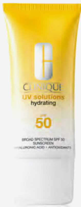
واقى شمس يو في سوليوشنز مرطب عامل حماية +50 40 مل AED 152