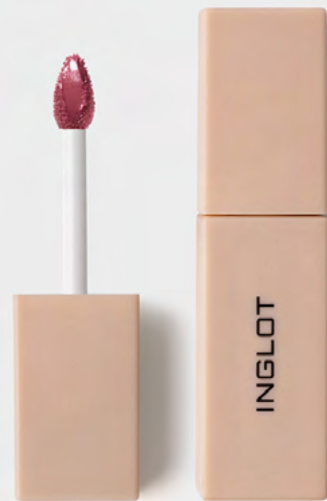
أحمر شفاه غليزد لبس سائل عامل حماية +50 AED 99