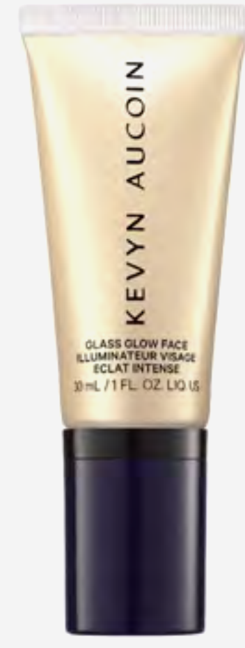
هايليتير كيفين أوكوين غلاس غلو سولار كوارتز AED 145