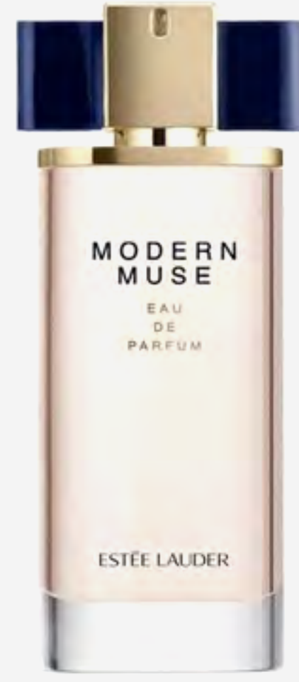
عطر مودرن ميوز AED 444