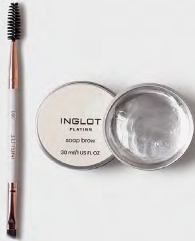
مجموعة حواجب بلايين براو باديز مكياج AED 129