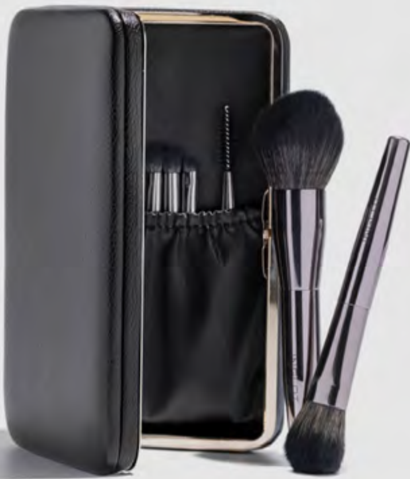
مجموعة فرش مكياج في حقيبة دمج AED 259