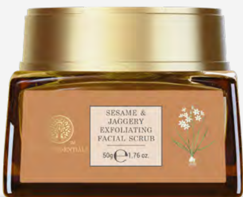
مقشر وجه سمسم وجاجري 50 غ AED 125