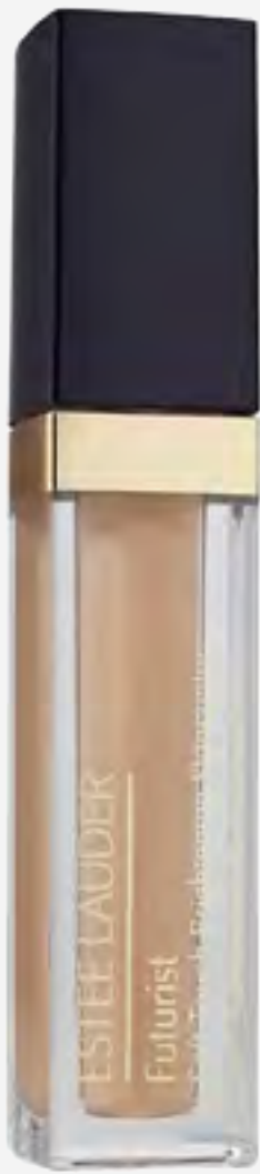
كونسيلر فيوتشرست سكينسيلر AED 155