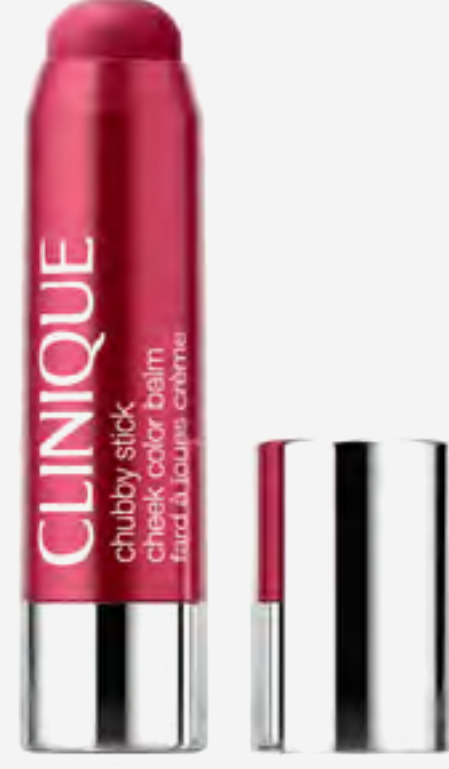
بلسم خدود تشبي ستيك ملون AED 145