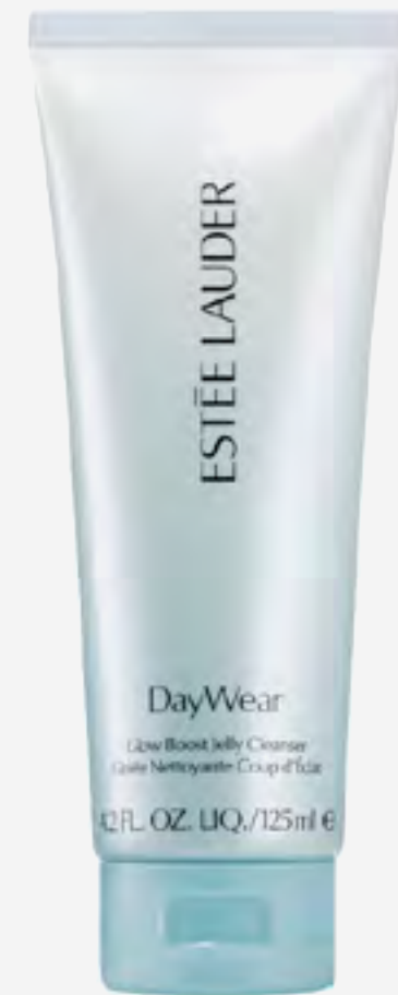
غسول دايوير AED 119