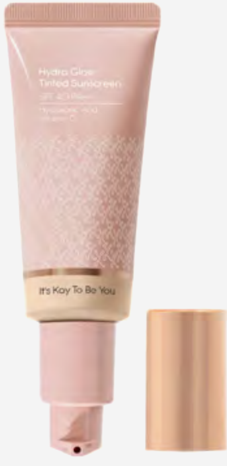
واقى شمس كاي بيوتي هيدراً غلو بلون AED 110