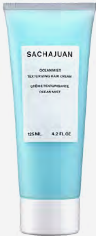
كريم شعر ساشاجوان أوشين ميسيت لتصفيف وتحديد AED 165