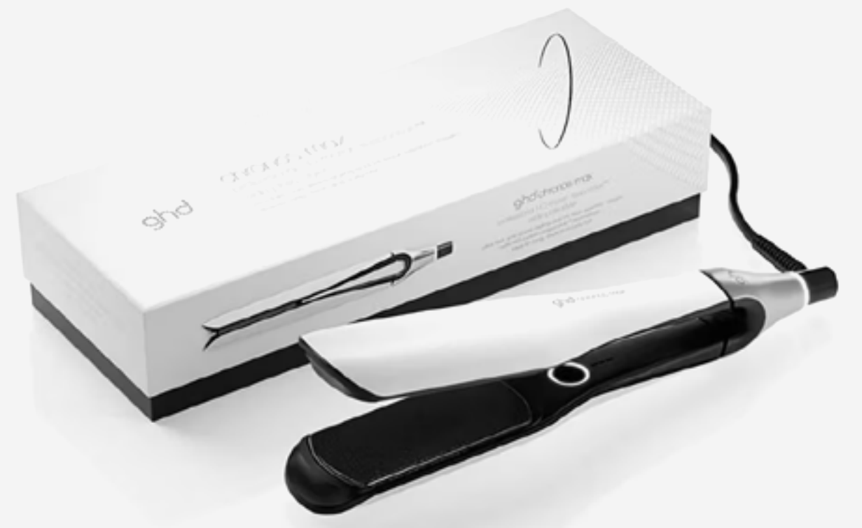
جى اتش دي مملس شعر كرونوس ماكس موانا+ بلوات عريضة أبيض AED 2099