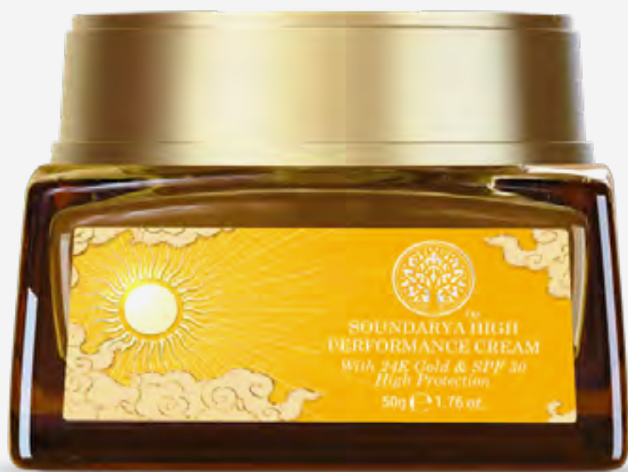
كريم سونداريا عالي الأداء بذهب عيار 24 و عامل حماية 30+ 50 غ AED 375