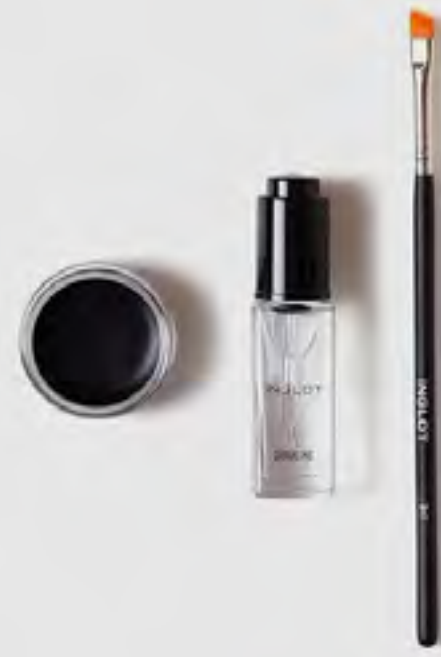
مجموعة عيون آي إسینشالز أساسي AED 179