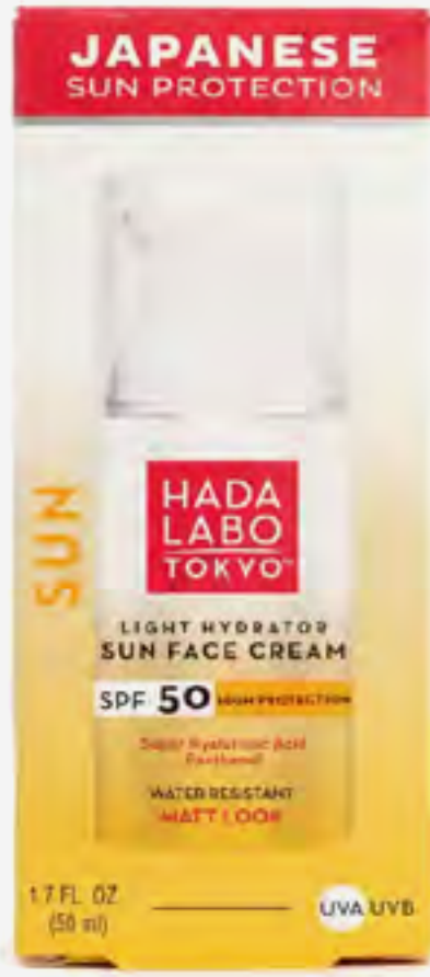
كريم وجه هادا لابو طوكيو واقى شمس مرطب خفيف عامل حماية+50 مطفي AED 178