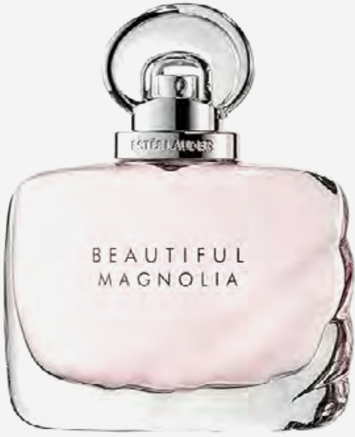
عطر بيوتيفول ماغنوليا AED 665