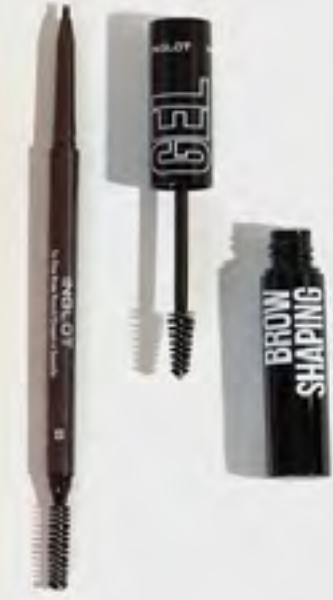
مجموعة حواجب بارتنز إن براوز مكياج AED 59