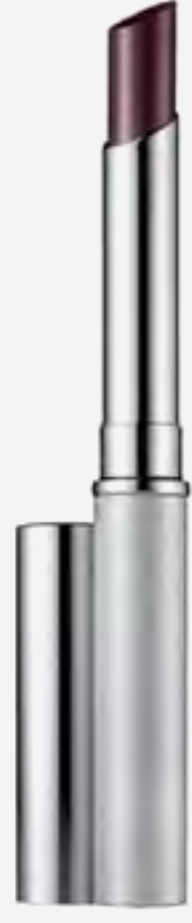
أحمر شفاه أولموست بلاك هوني AED 155