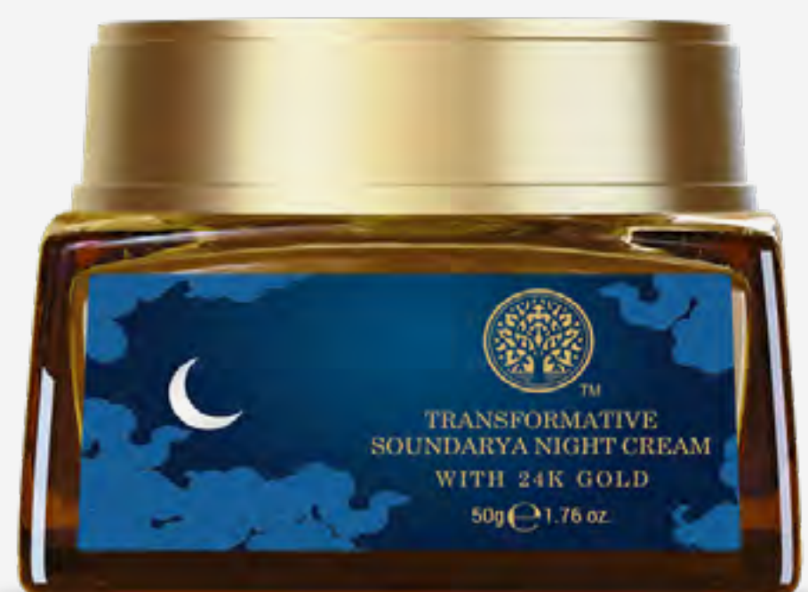
كريم سونداريا ليلي تحولي 50 غ AED 450