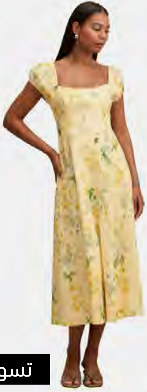
فستان سادي ميدي كتان بأكمام كاب AED 529