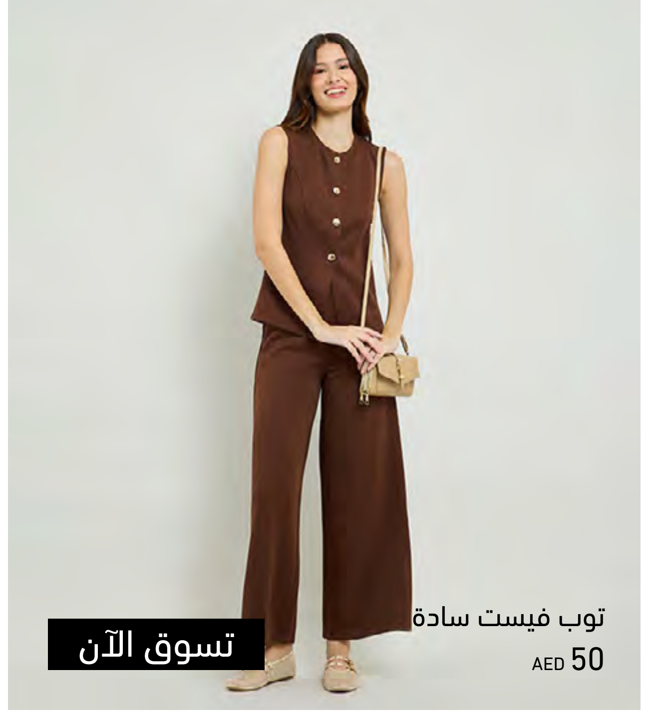
توب فيست سادة AED 50