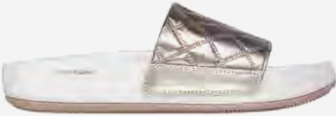
حذاء سلايد مبطن أرش فيت هايبر AED 349