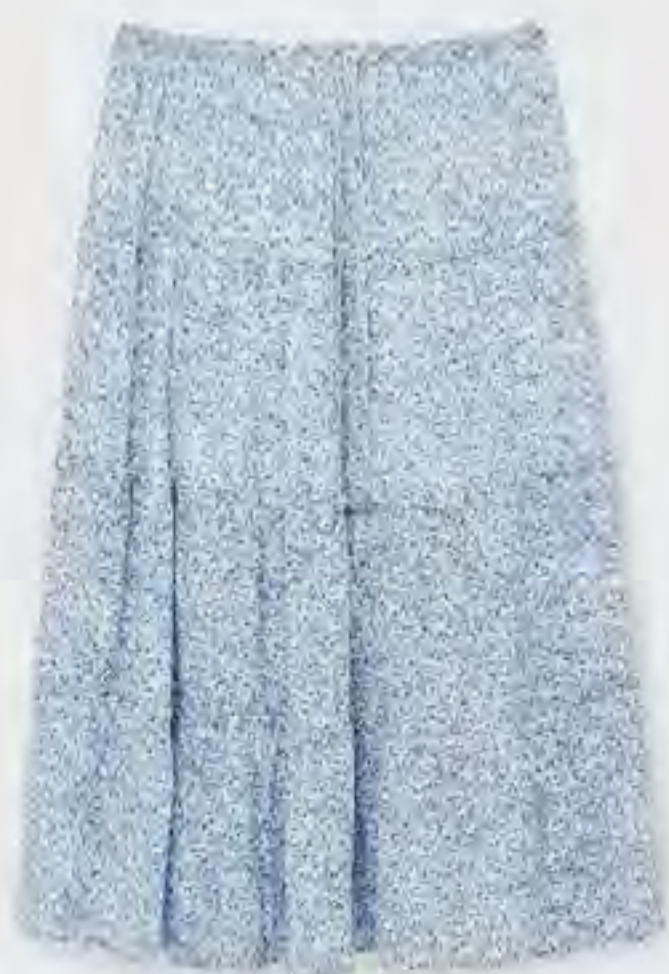
تنورة ماكسي مطبوعة بخصر مطاطي