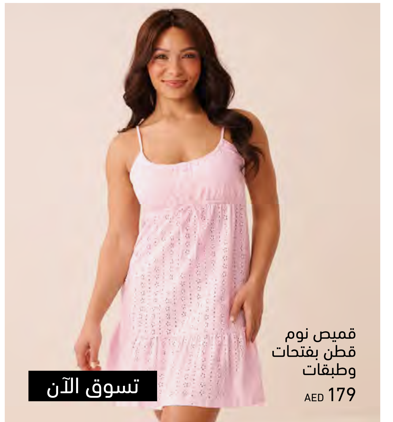
قميص نوم قطن بفتحات وطبقات AED 179