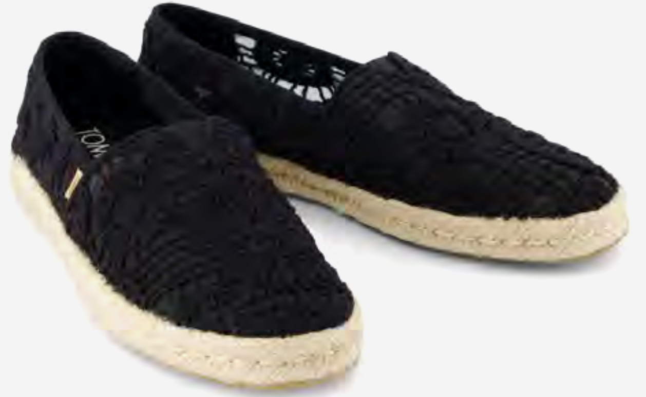
حذاء ألبارغاتا روب 2.0 إسبادريل كروشيه AED 399