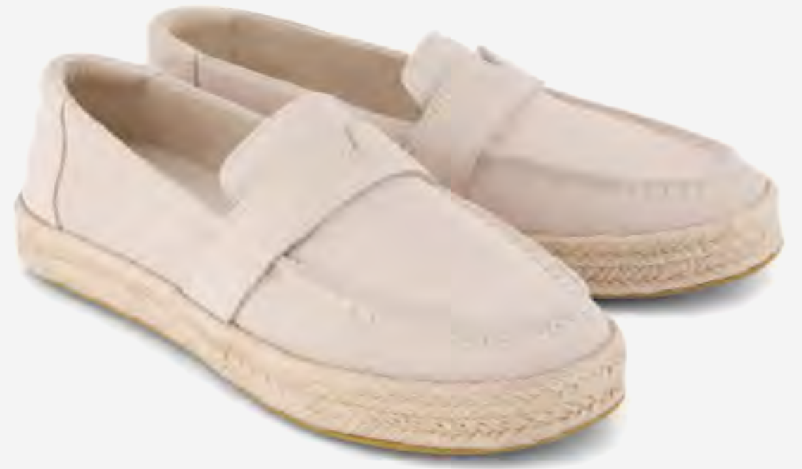
حذاء بليكلي إسبادريل بمقدمة مستديرة AED 549