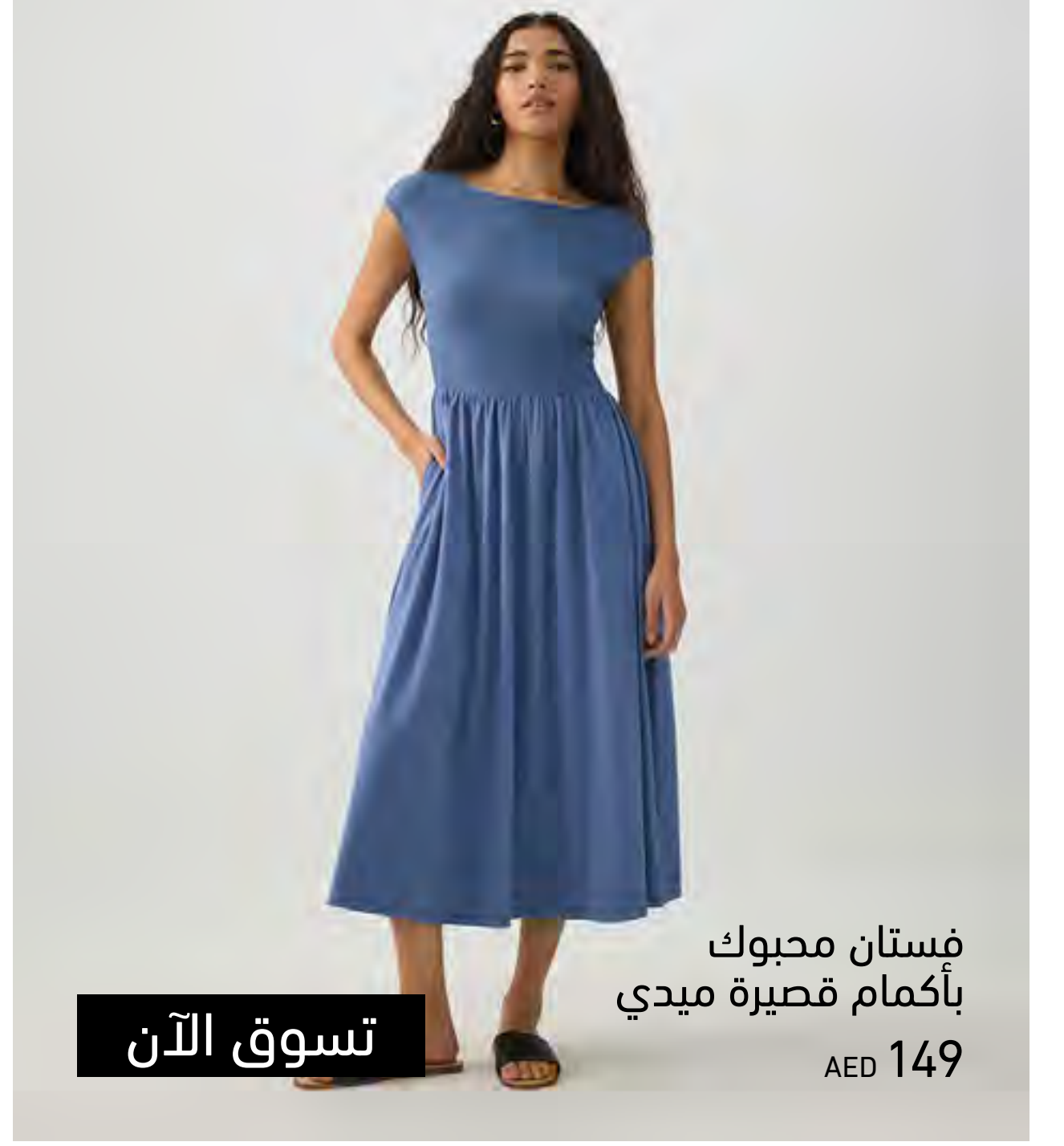
فستان محبوبك بأكمام قصيرة ميدي AED 149