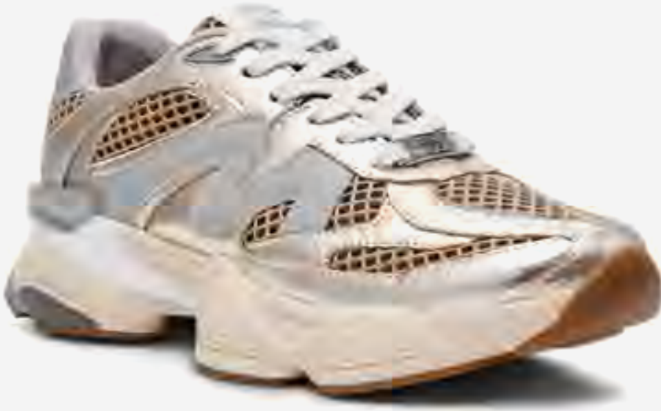
حذاء سبيدر رياضي منخفض محاك AED 449