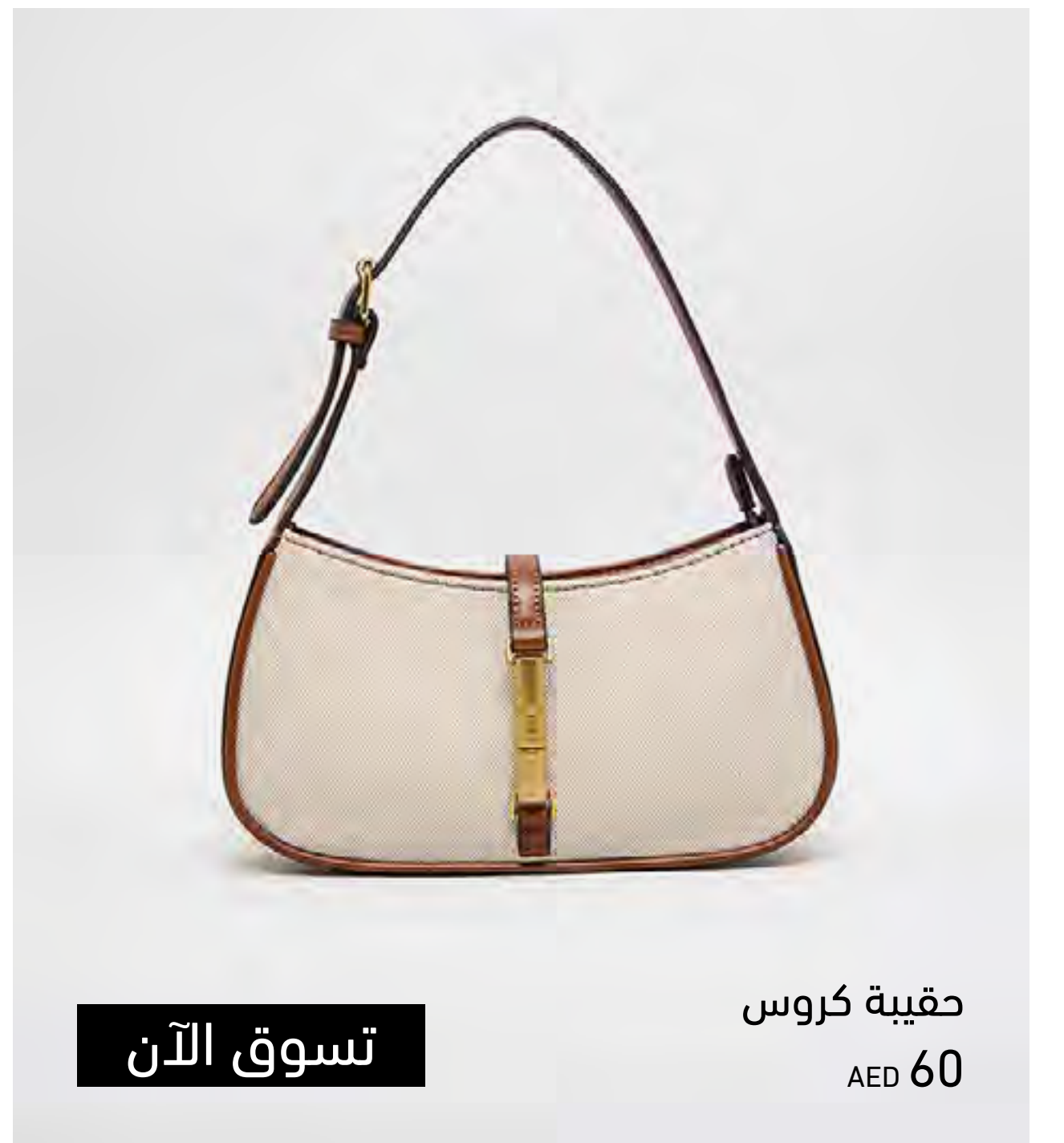
حقيرة كروس AED 60