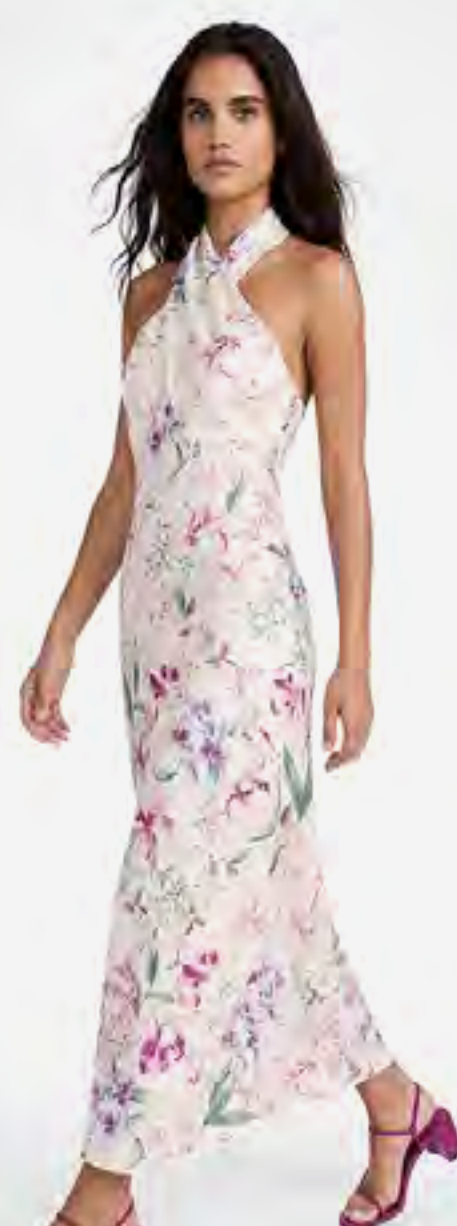
فستان ميدي ساتان بنقشة زهور