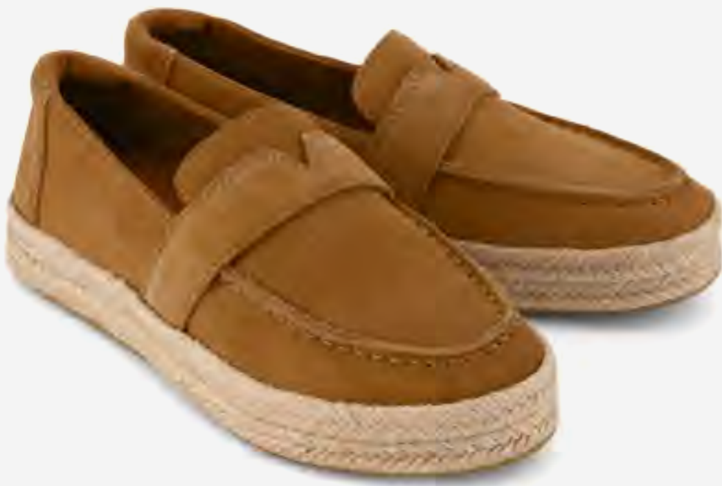
حذاء بليكلي إسبادريل بمقدمة مستديرة AED 549