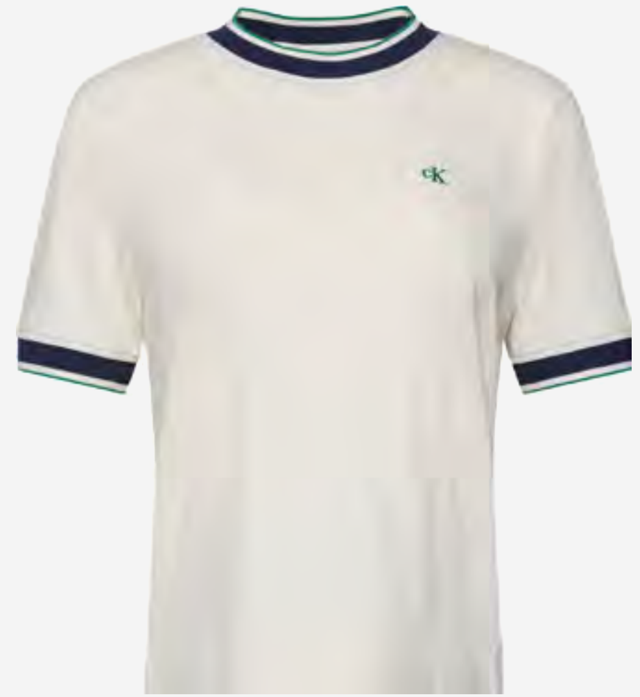
تيشيرت قطن بقبة مستديرة مطرز مونوغرام AED 400