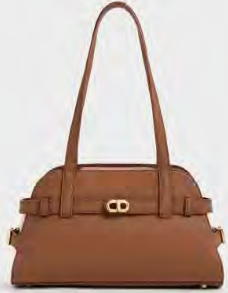
حقيبة أوبريل كتف بحزام AED 575