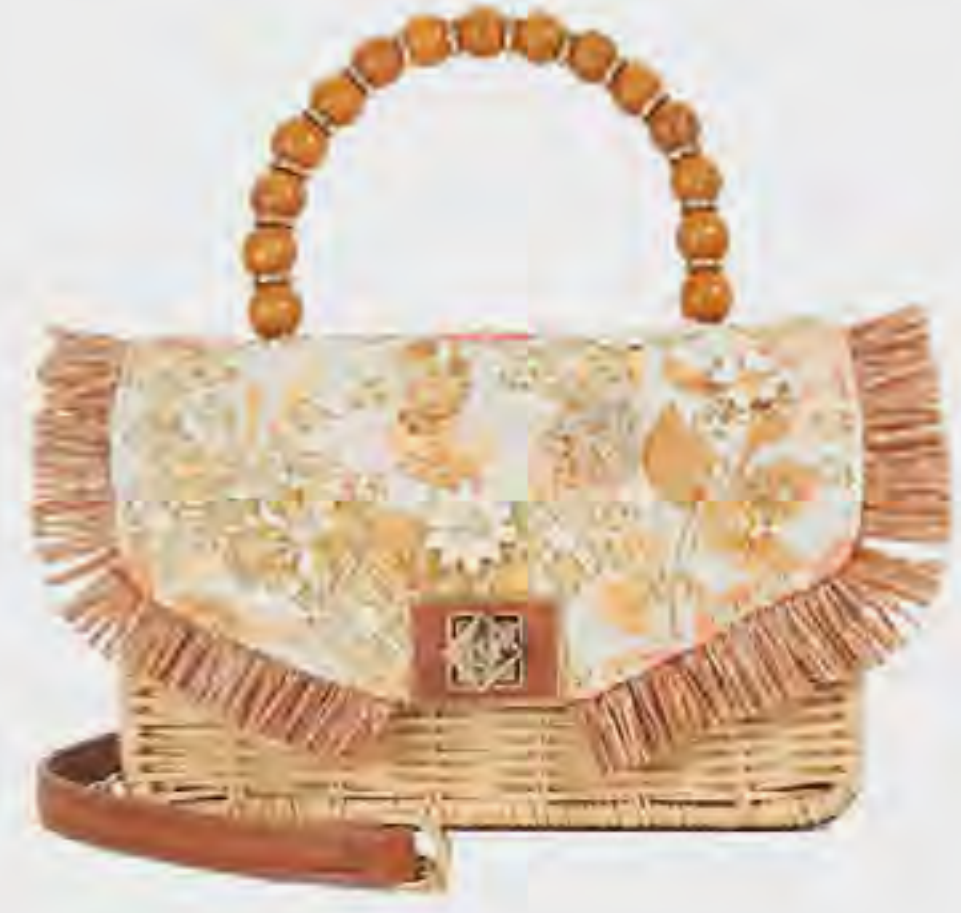
حقيبة بلومز يد بغطاء مزين AED 449