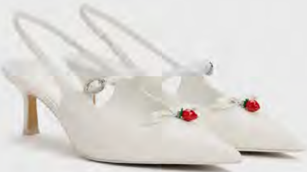
حذاء سونالي بكعب ومقدمة الفراولة AED 375