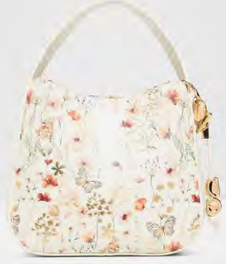
حقيبة يد أفيما بنقشة زهور AED 349