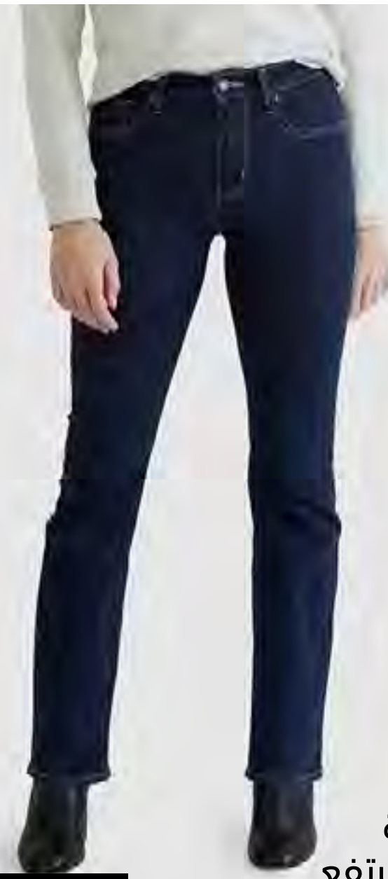
جينز 725 قصة ضيقة وخصر مرتفع AED 349