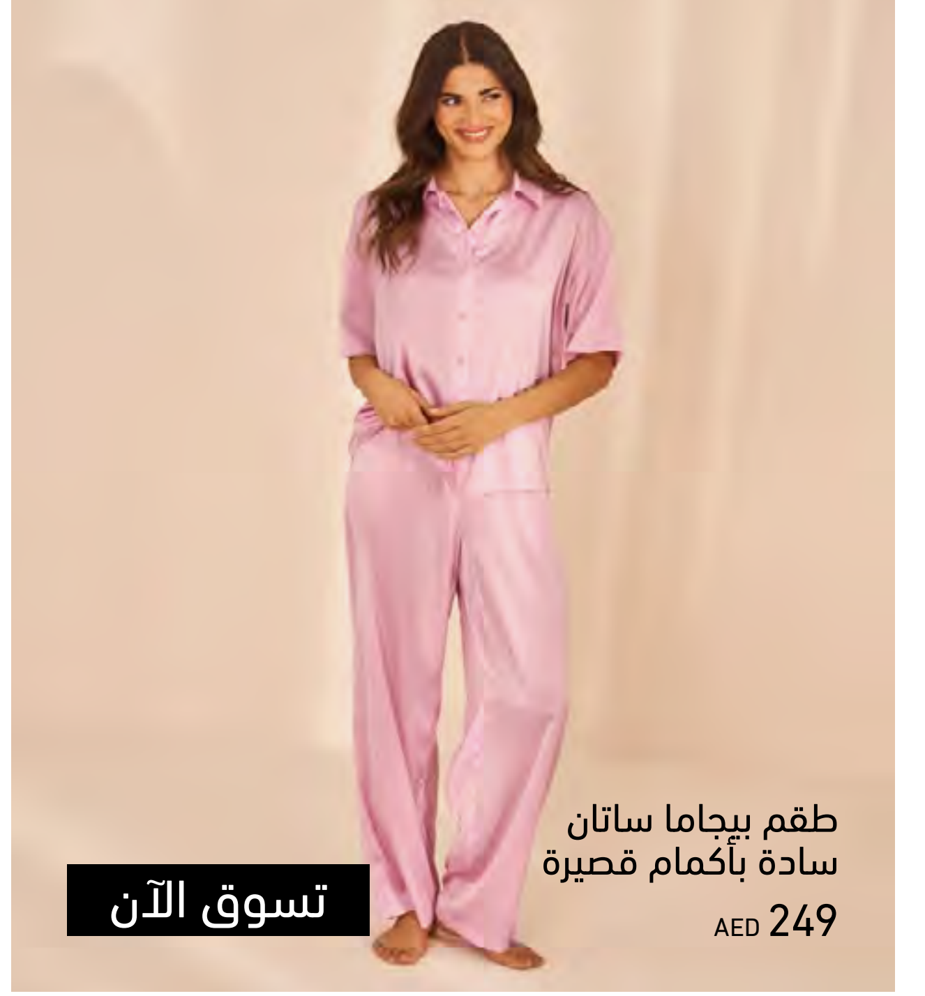
طقم بيجاما ساتان سادة بأكمام قصيرة AED 249