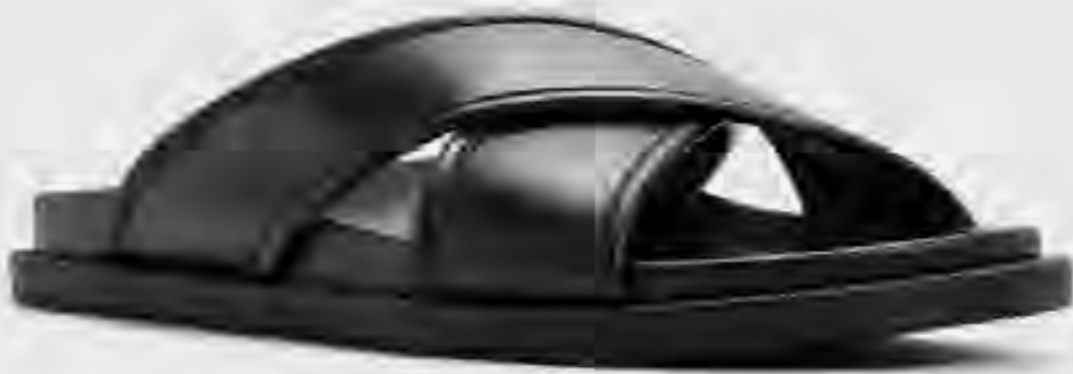
صندل فيرانو بسيور متقاطعة AED 229