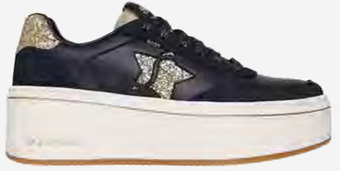
حذاء بالوما رياضي بلا تفورم برباط AED 499