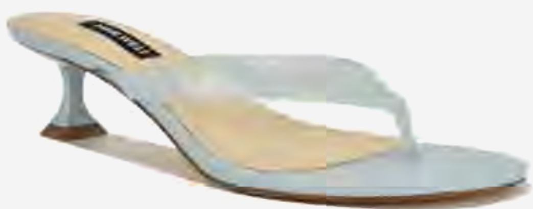
صندل كريسي بكعب ومقدمة مستديرة AED 379