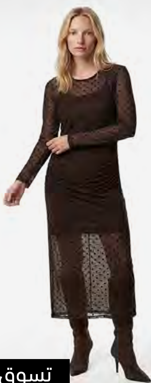
فستان ميدي تول بأكمام طويلة ونقاط بولكا