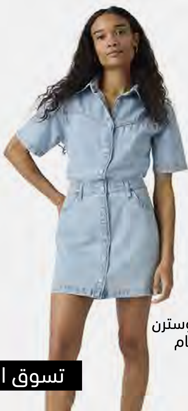
فستان لوجان وسترن جينز قصير باكمام قصيرة AED 399