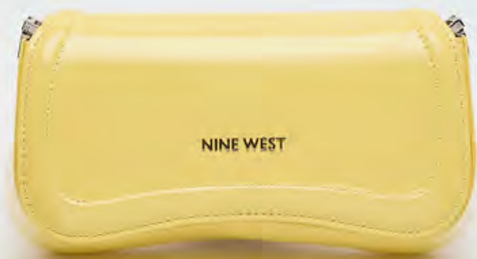
حقيبة كتف بغطاء وتفاصيل شعار AED 379