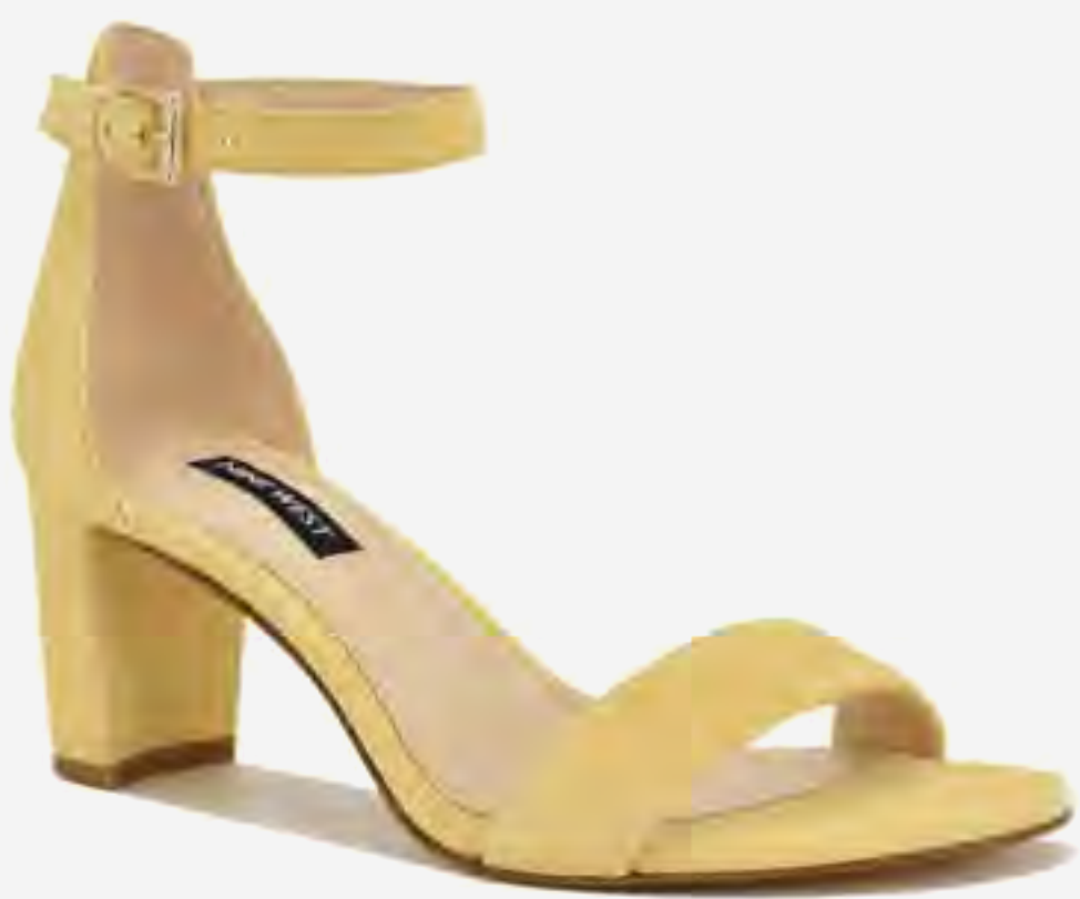
صندل بروس بكعب وسير كاحل AED 389