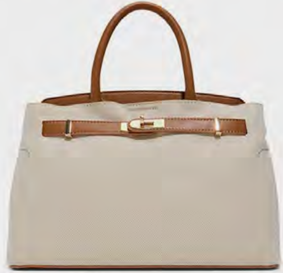
حقيبة ليميرسير ساتشيل محاكاة AED 279