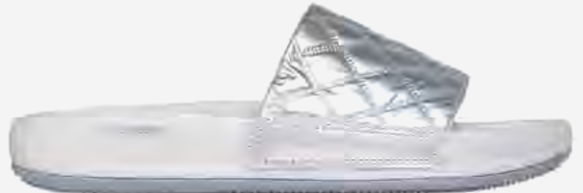
حذاء سلايد مبطن أرش فيت هايبر AED 349