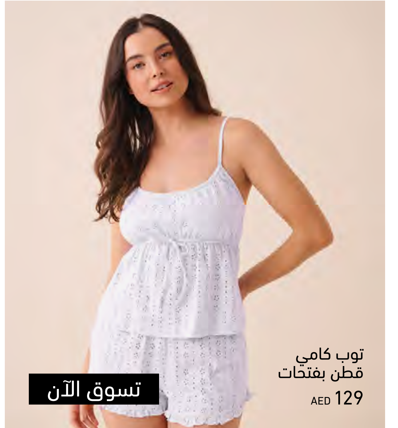
توب كامي قطن بفتحات AED 129