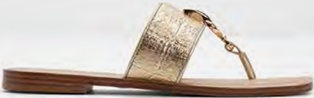
صندل مادلين مسطح بسيور AED 349