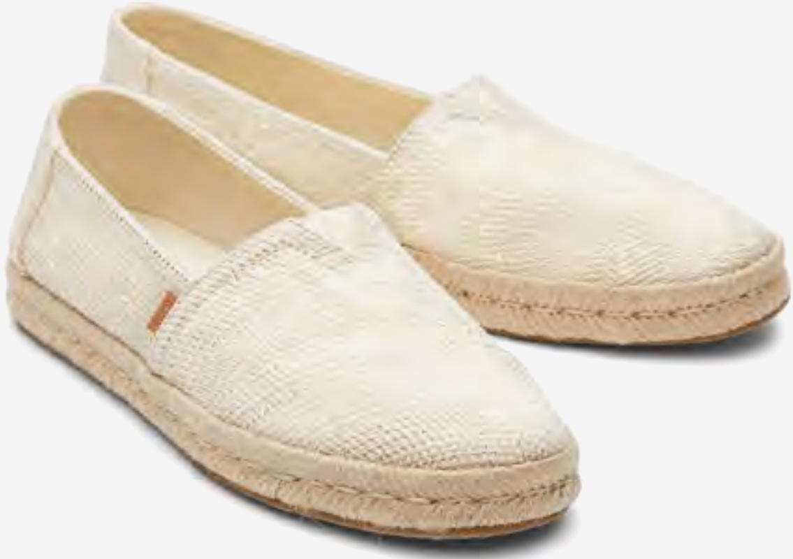
حذاء ألبارغاتا روب 2.0 إسبادريل محاك AED 449