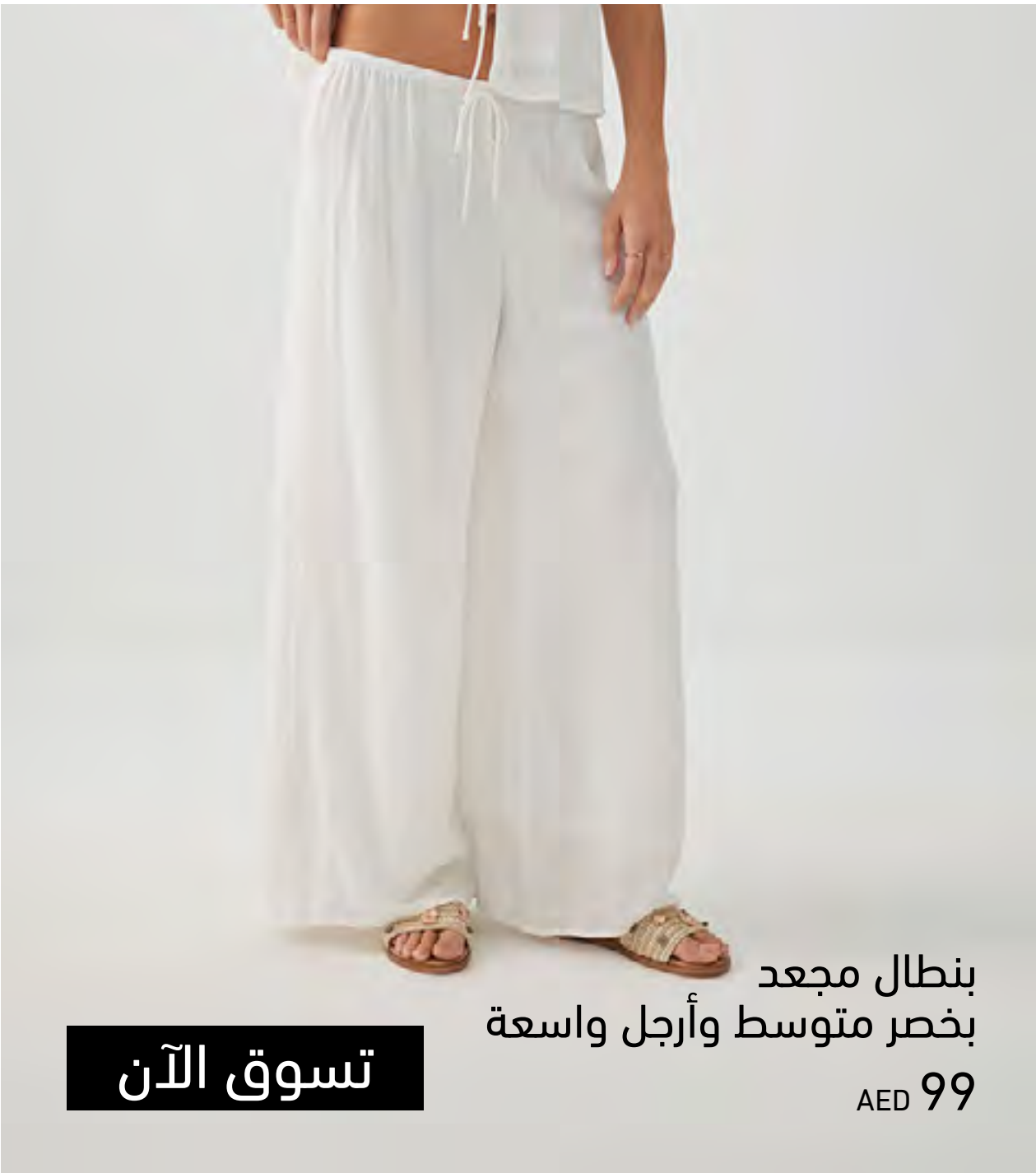
بنطال مجعد بخصر متوسط وأرجل واسعة AED 99