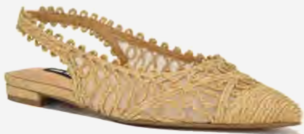
حذاء جوفياس 2 مسطح برباط خلفي AED 379