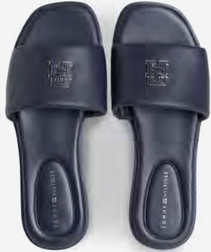
حذاء ميول جلدي مسطح مزين بتفصيلة AED 560