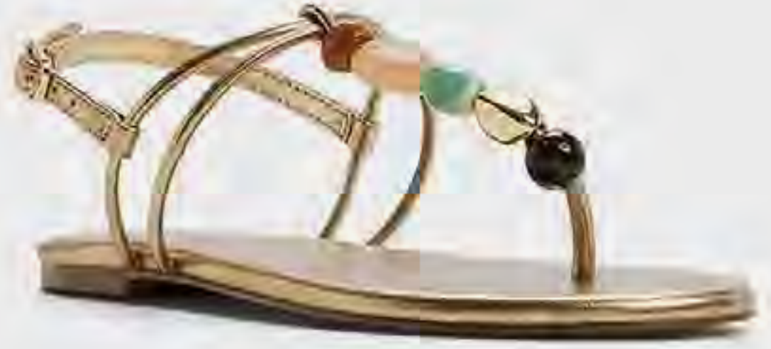
صندل توباز مسطح بتفاصيل أحجار AED 279