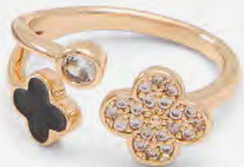
خاتم زانثا مزين AED 79