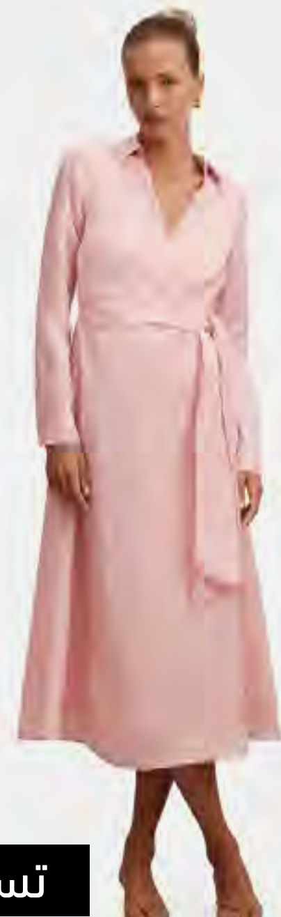
فستان أنجيلينا ميدي بأكمام طويلة وأربطة AED 529