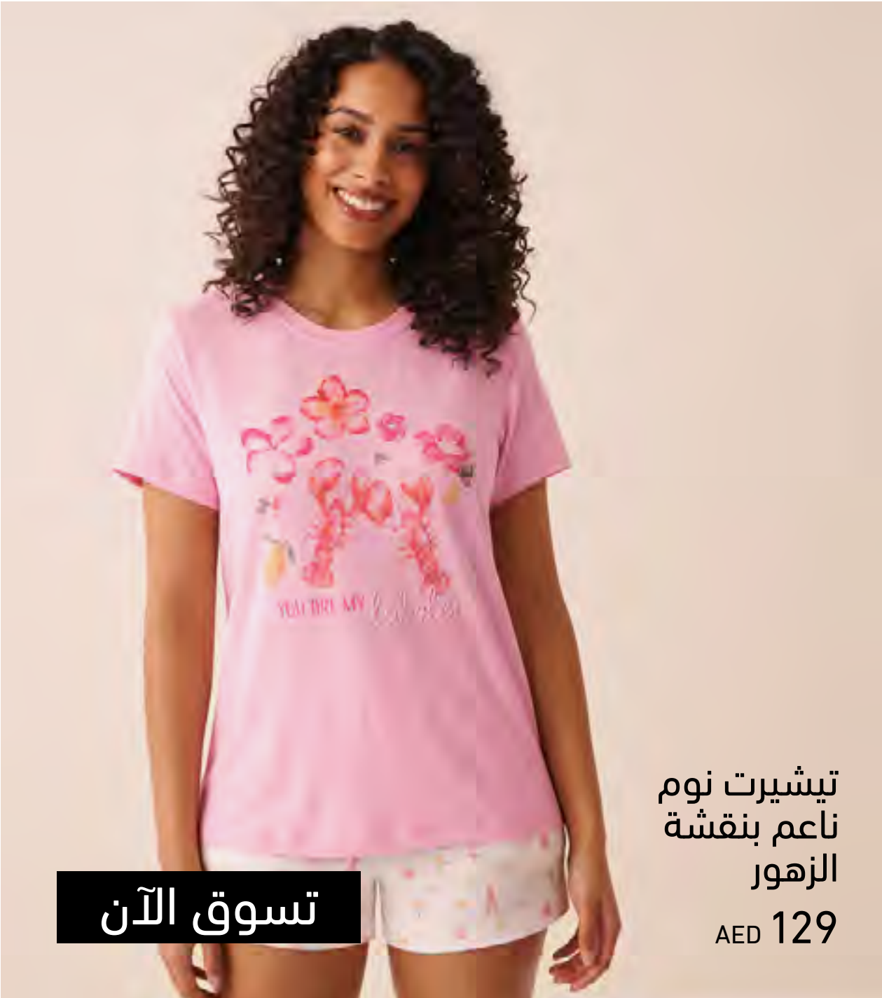
تيشيرت نوم ناعم بنقشة الزهور AED 129