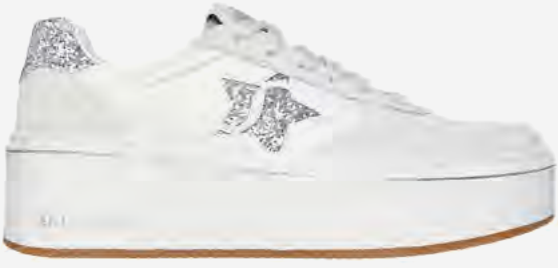
حذاء بالوما رياضي بلا تفورم برباط AED 499