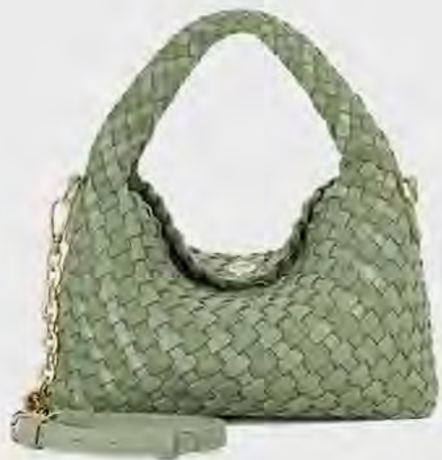
حقيبة دينكيديلبريت هوبو صغيرة منسوجة AED 449