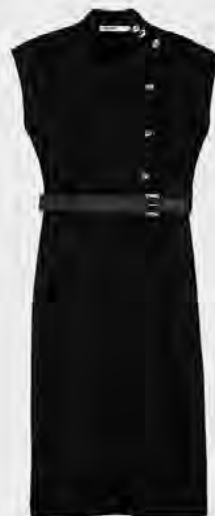
فستان قصير بحزام وبدون أكمام