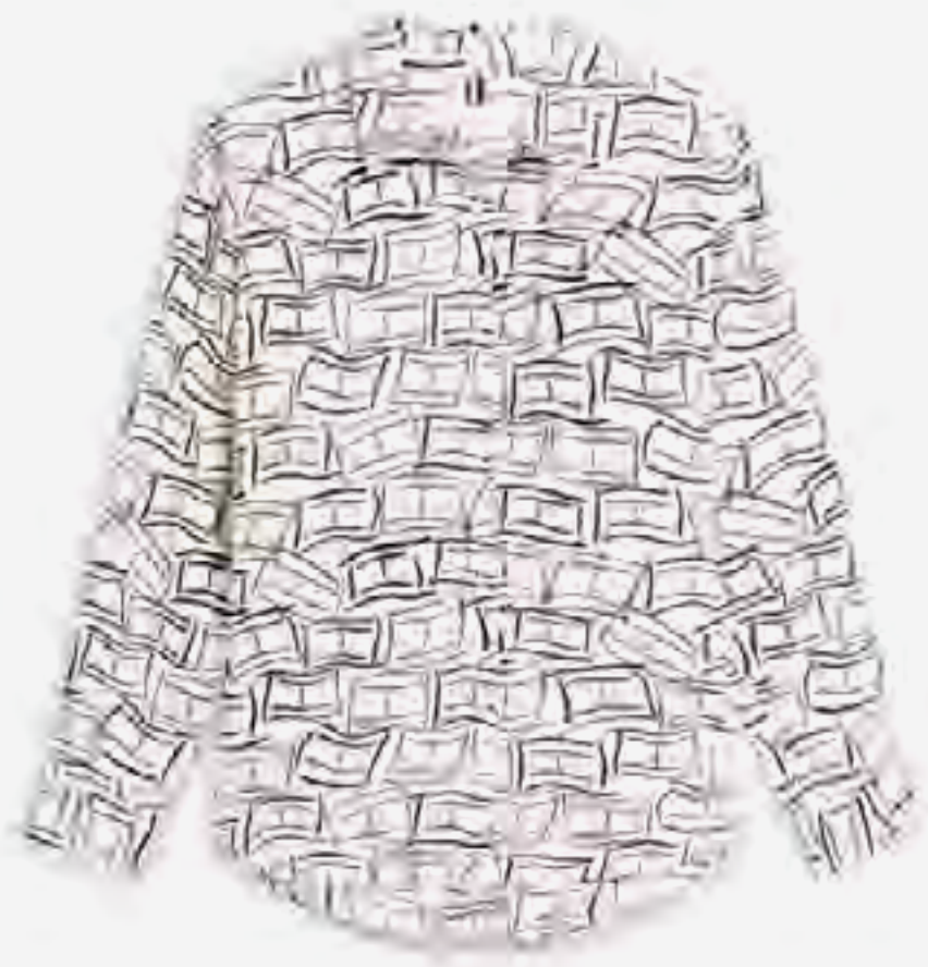
قميص من الكتان النقي بقصة مريحة AED 750