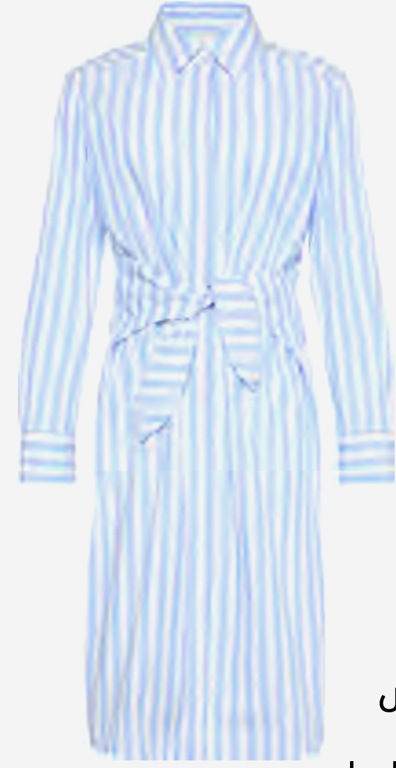
فستان قميص بوبلين قطن مخطط كم طويل AED 900