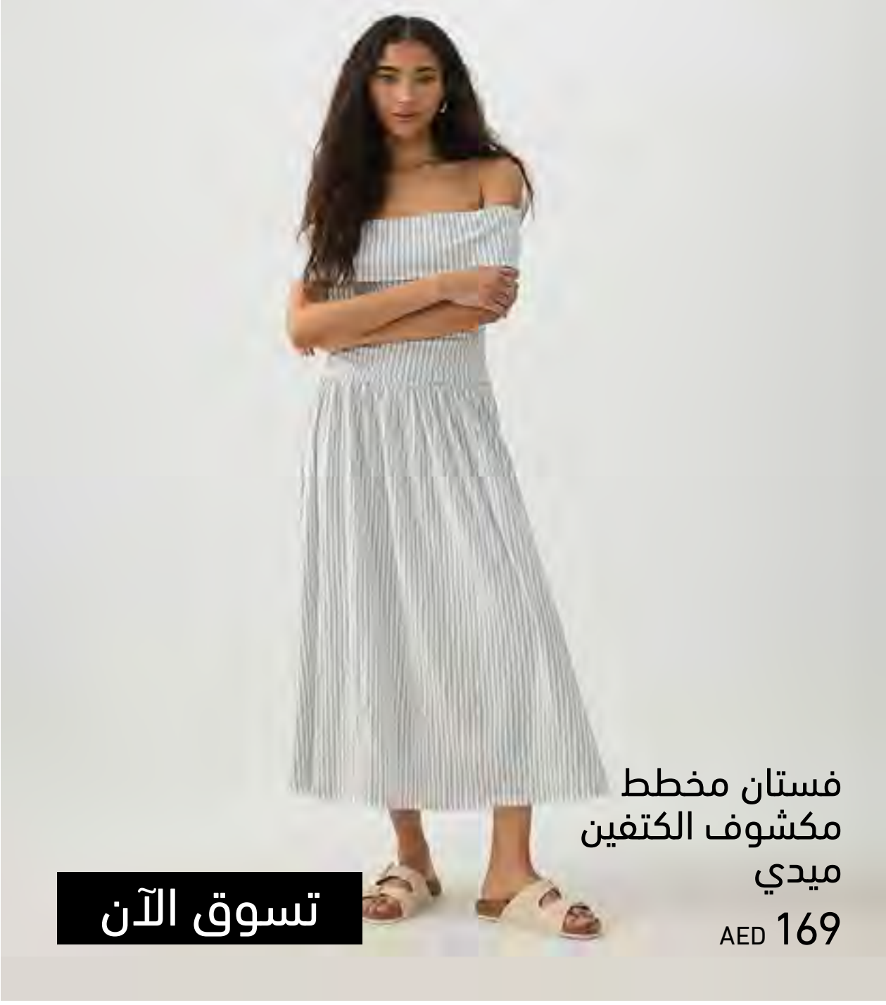
فستان مخطط مكشوف الكتفين ميدي AED 169