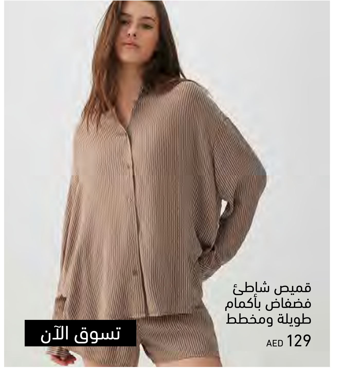
قميص شاطئ فضفاض بأكمام طويلة ومخطط AED 129