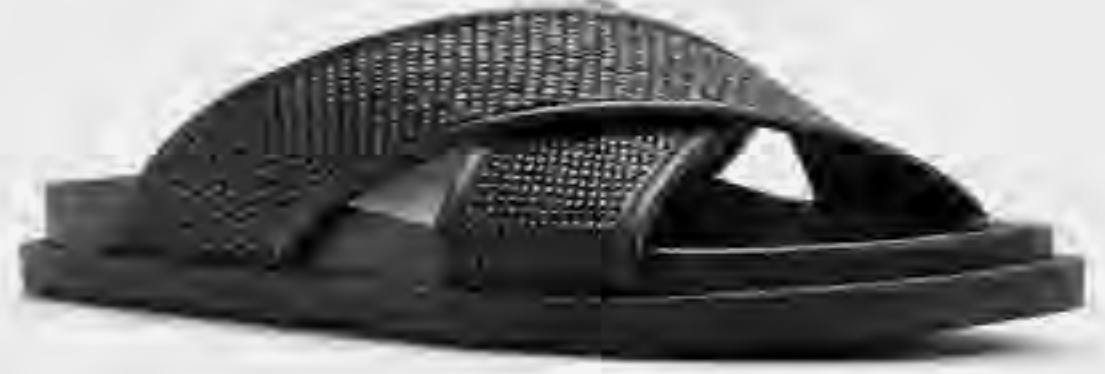
صندل فيرانو محاك بسيور متقاطعة AED 229