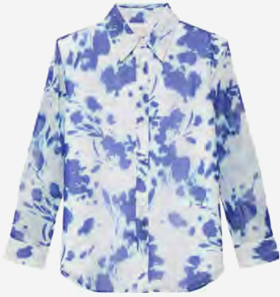
قميص تاي داي بكم طويل AED 650