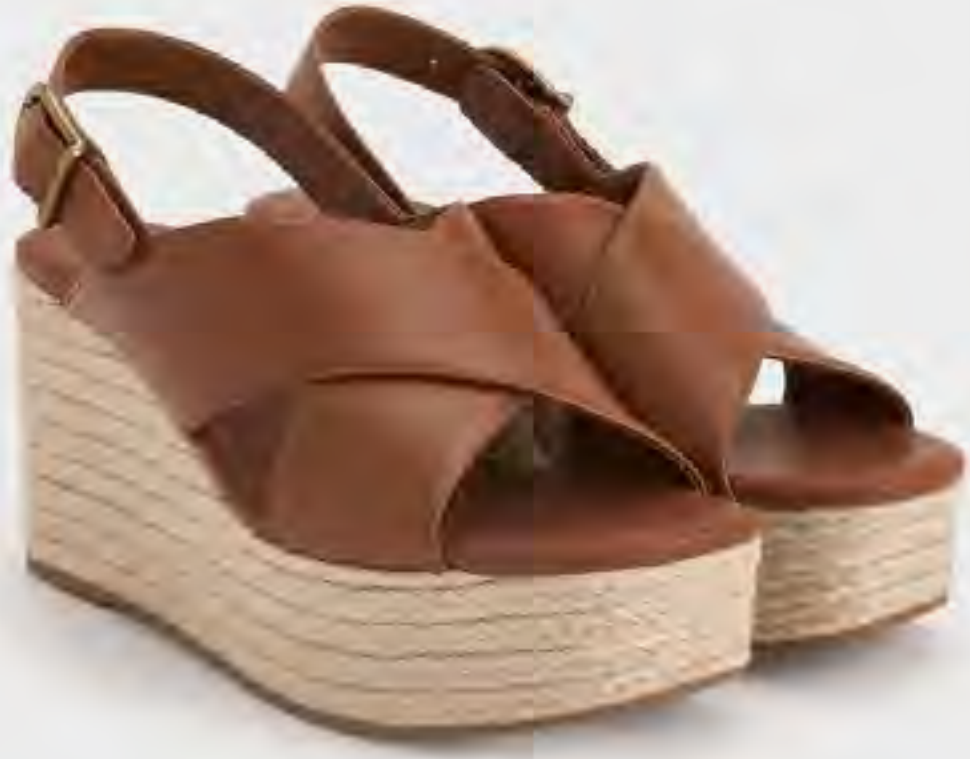
صنل وتد إسبادريل متقاطع AED 450