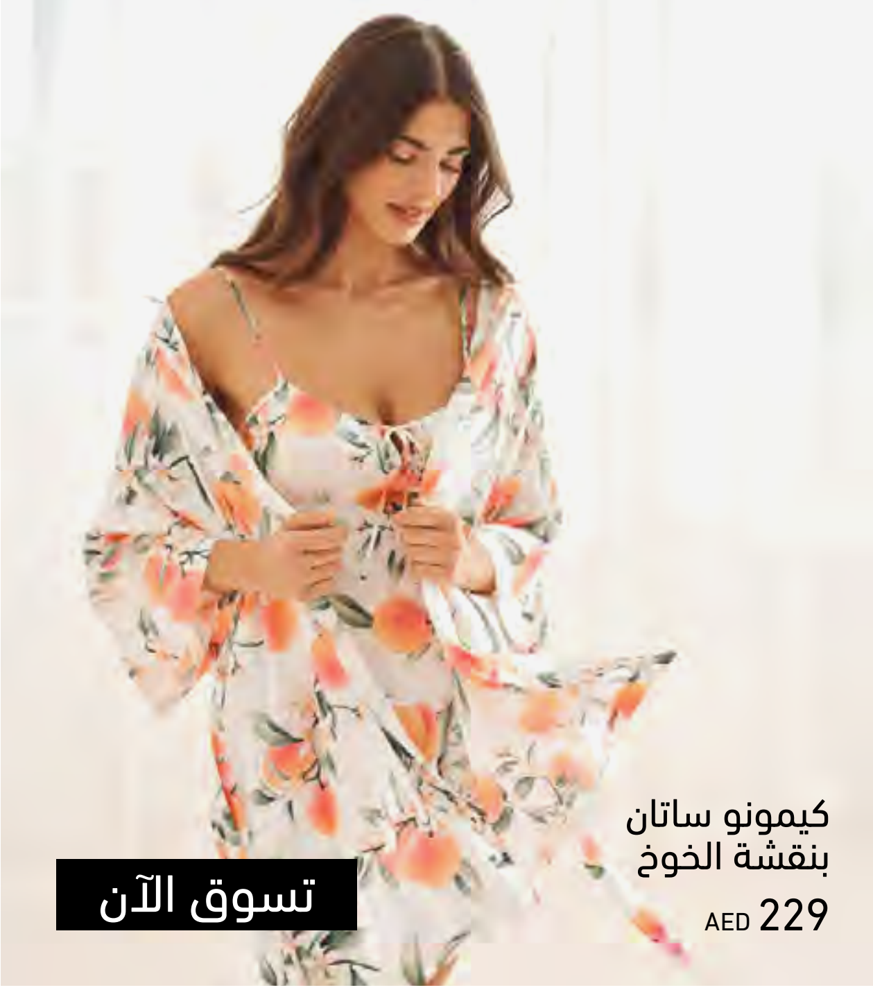
كيمونو ساتان بنقشة الخوخ AED 229