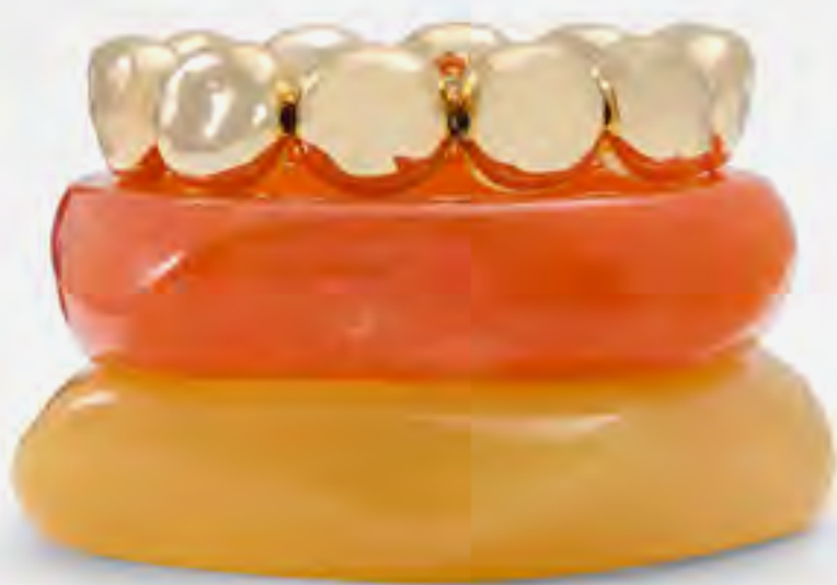
سوار سونفايبس عريض ملون AED 149