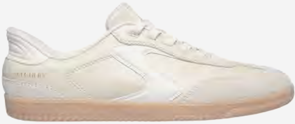
حذاء هوتشوت رياضي برباط AED 429