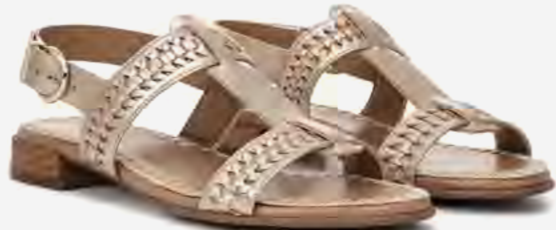
صندل نانبا بكعب وسيور مضفرة AED 499