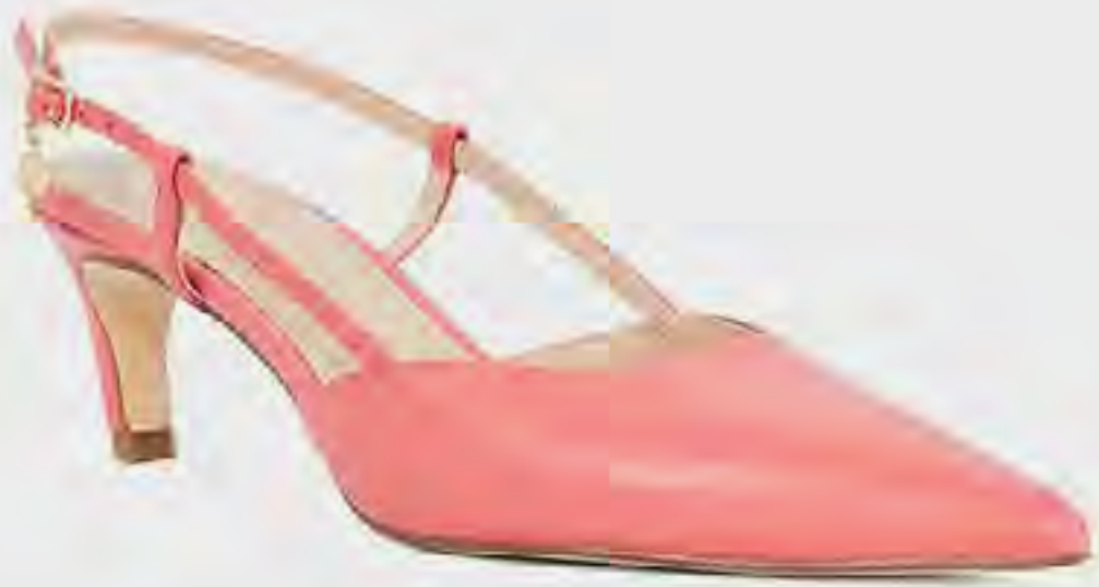
حذاء كلارينا بكعب ومقدمة مدببة AED 449