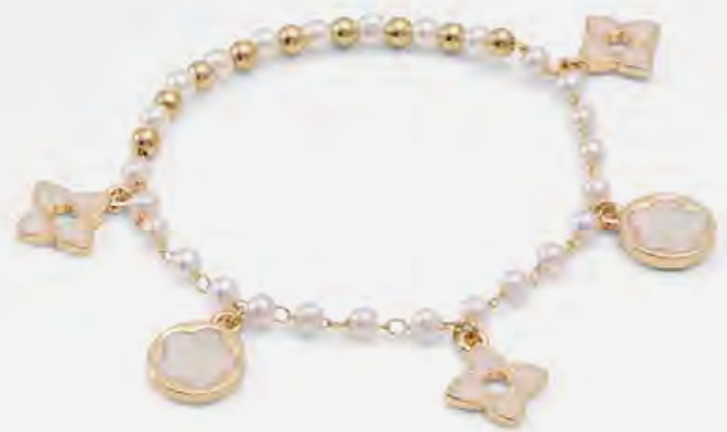
سوار لوسيز مزين باللؤلؤ AED 99