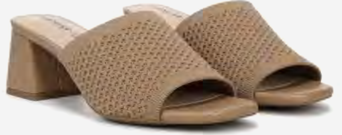
صندل كولييت 2 بكعب سميك محبوبك AED 399