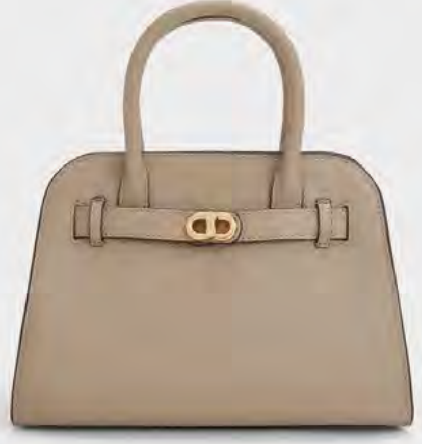
حقيبة أوبريل توت بحزام AED 575