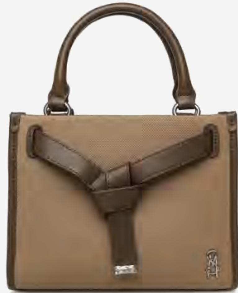
حقيبة بيكولي توت بتفاصيل عقدة AED 399