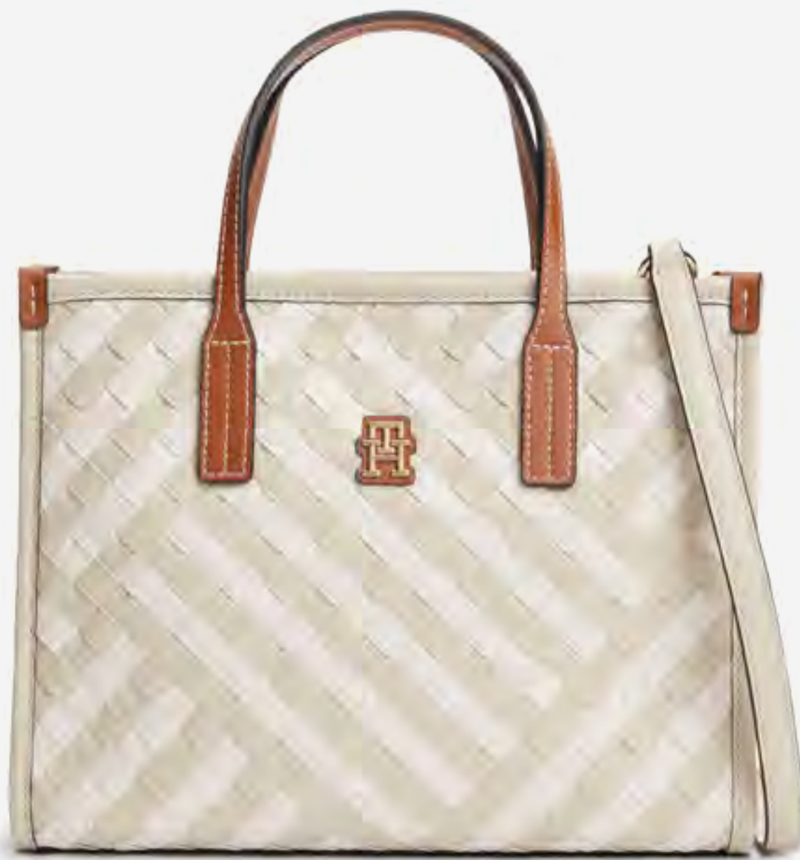
حقبة توت صغيرة AED 910