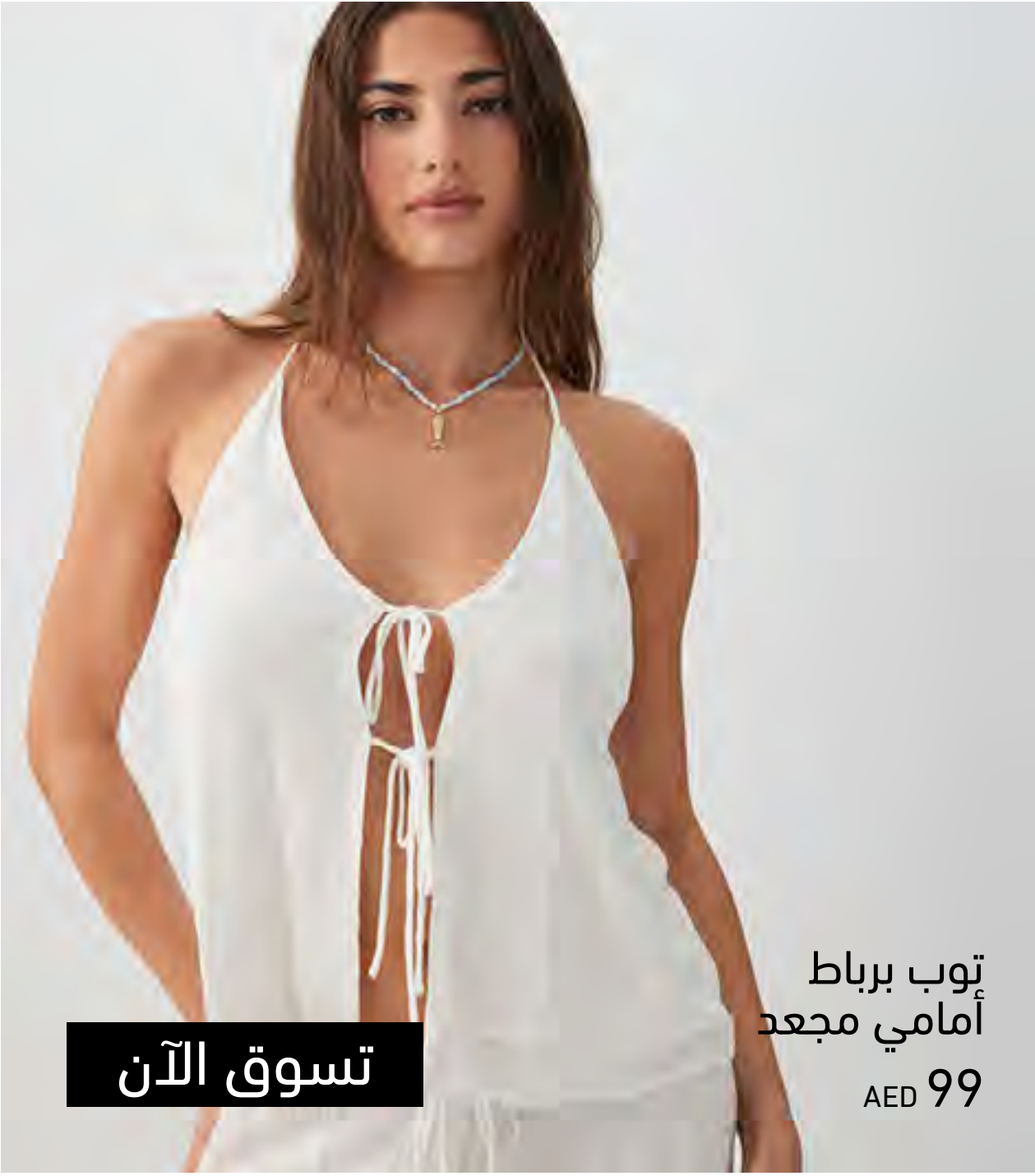
توب برباط أمامي مجعد AED 99