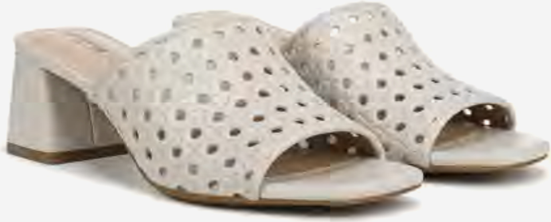
صندل كولييت 3 بكعب سميك محاك AED 399