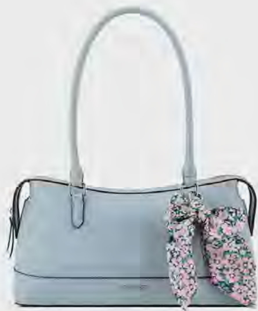
حقيبة كتف محاكاة AED 379