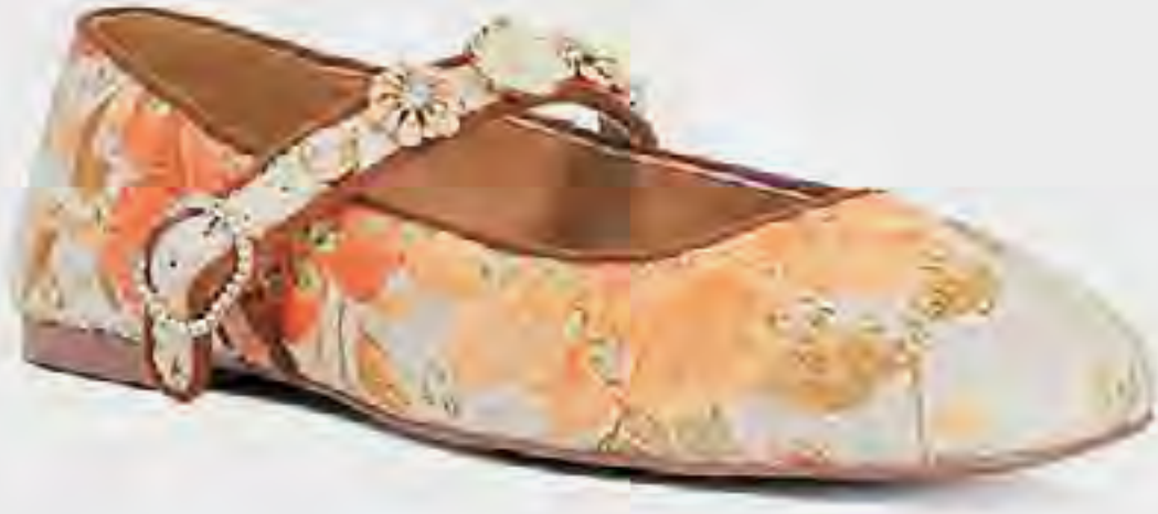
حذاء هنرييتا ماري جين منقوش AED 399