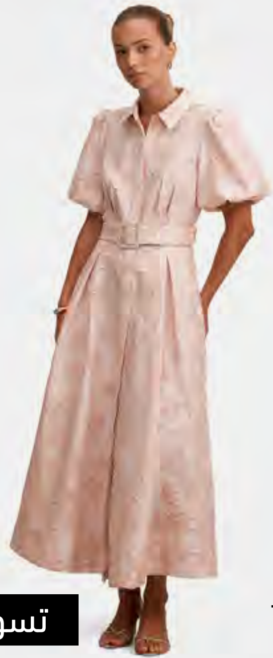
فستان جيل ماكسي جاكار AED 759