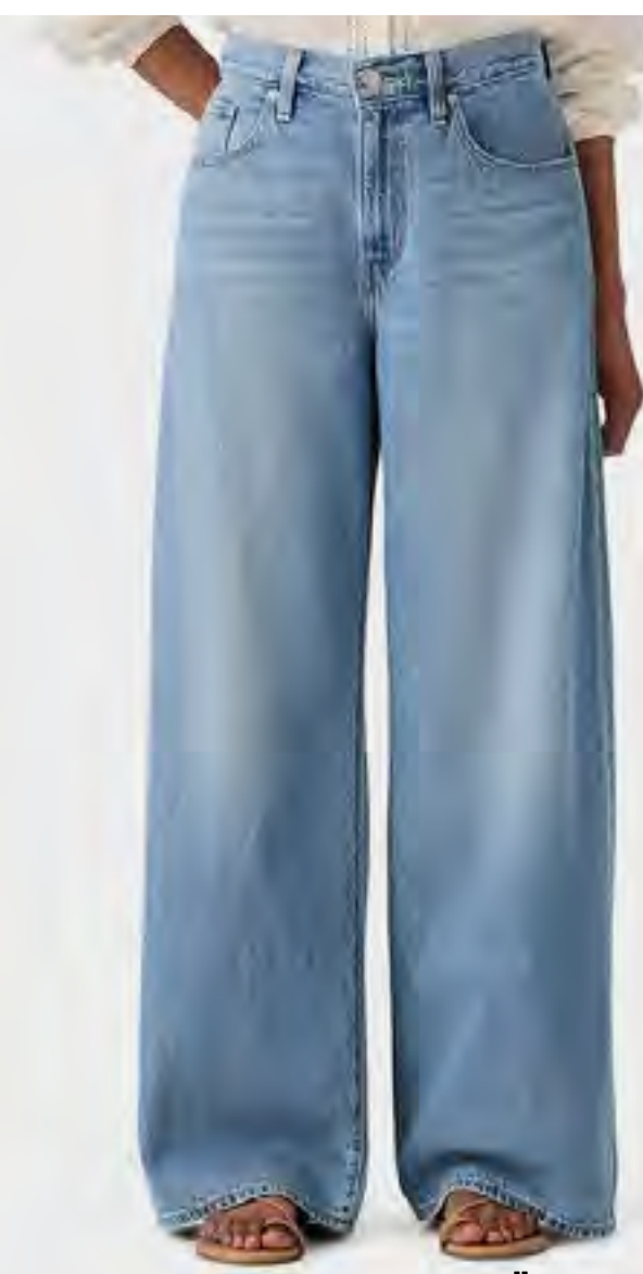
جينز قصة مستقيمة وخصر مرتفع باهت AED 399