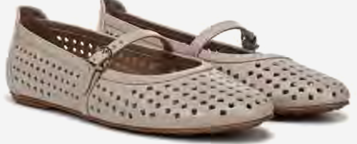
حذاء ناريا ماري جين بمقدمة مستديرة وقص ليزر AED 499