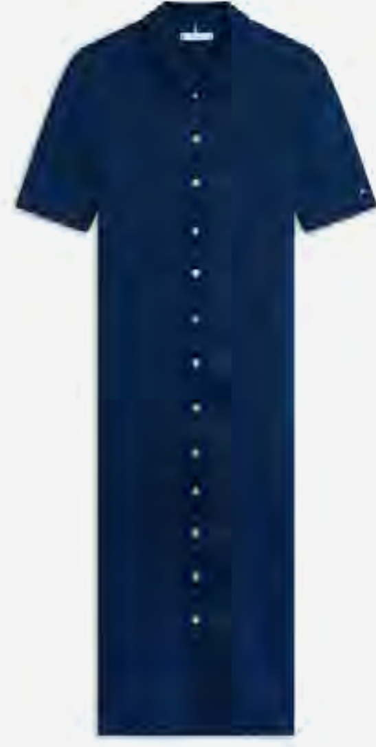
فستان ميدي بقبة AED 950