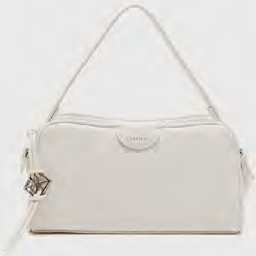
شنطة كتف بسحاب AED 700