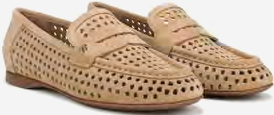
حذاء نابلوم لوفر بمقدمة مستديرة وقص ليزر AED 549