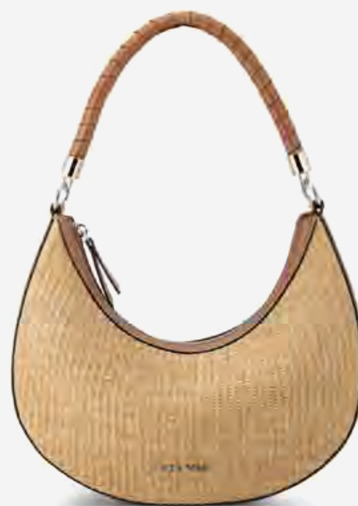
حقيبة كتف رافيا AED 379