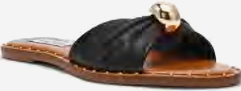
صندل ديبسي-سي إن مسطح بتفاصيل معدنية AED 299