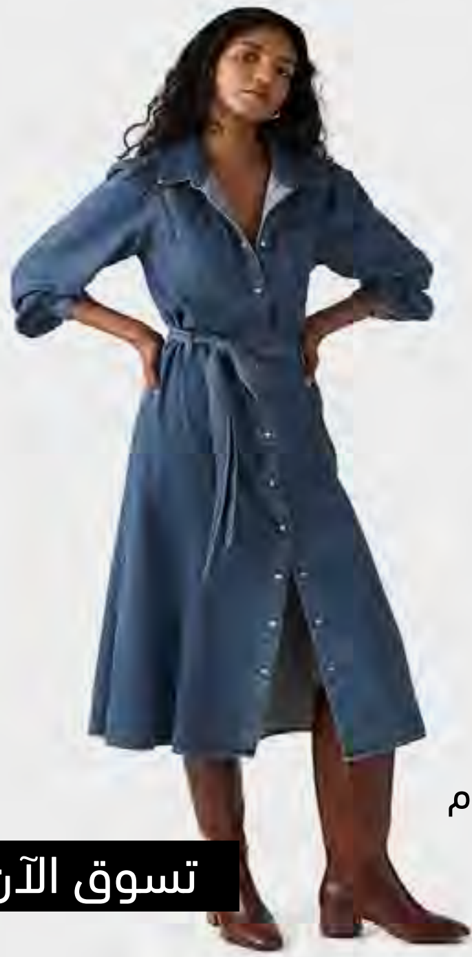
فستان جورني جينز ميدي باكمام طويلة AED 499