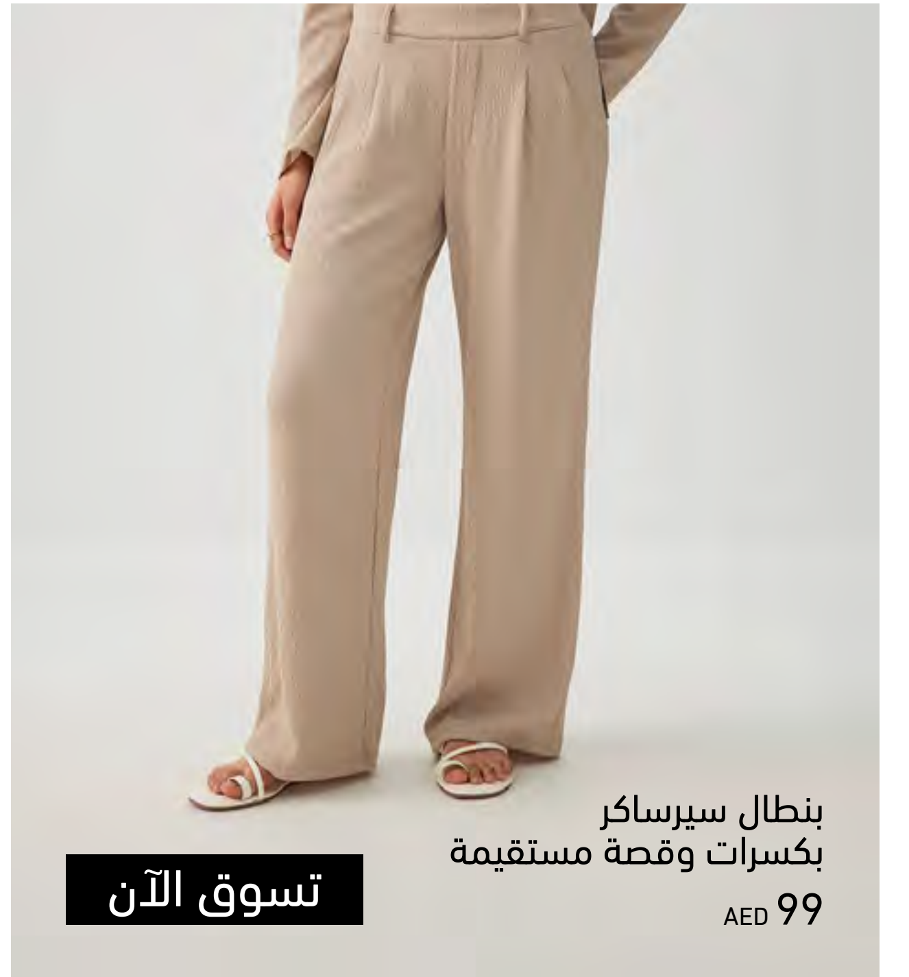
بنطال سيرساكر بكسرات وقصة مستقيمة AED 99