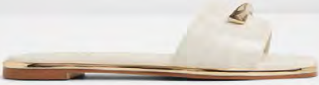
صندل دارلينا مسطح بتفاصيل إكسسوار AED 349