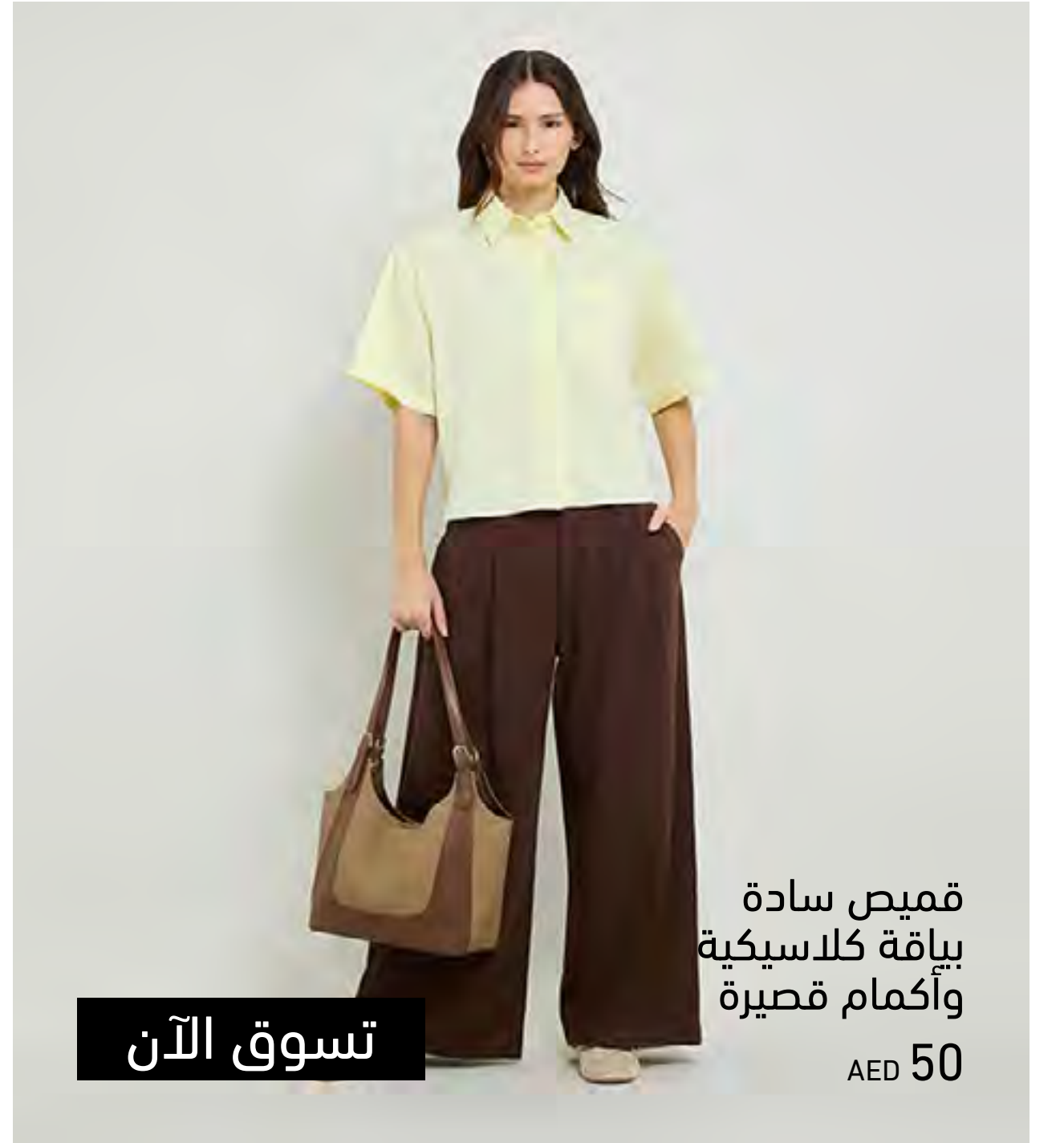
قميص سادة بياقة كلاسيكية وأكمام قصيرة AED 50