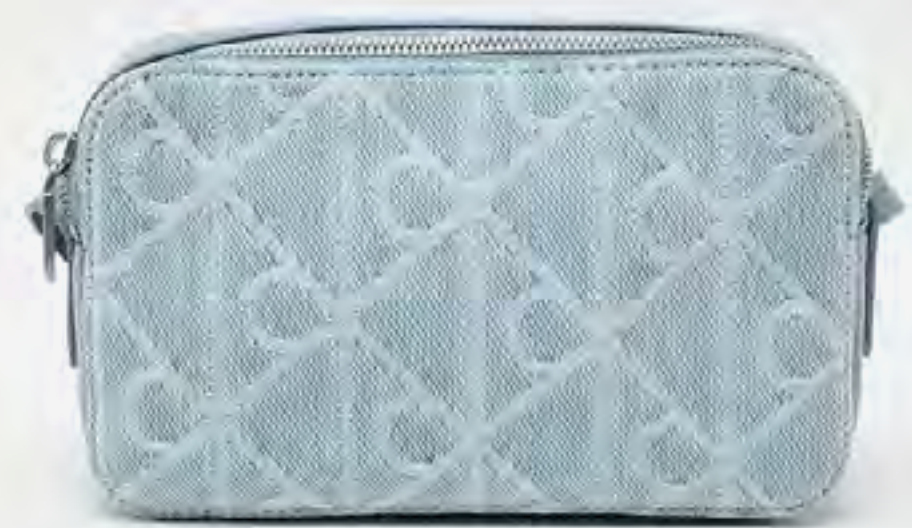
محفظة جينز مونوغرام AED 600