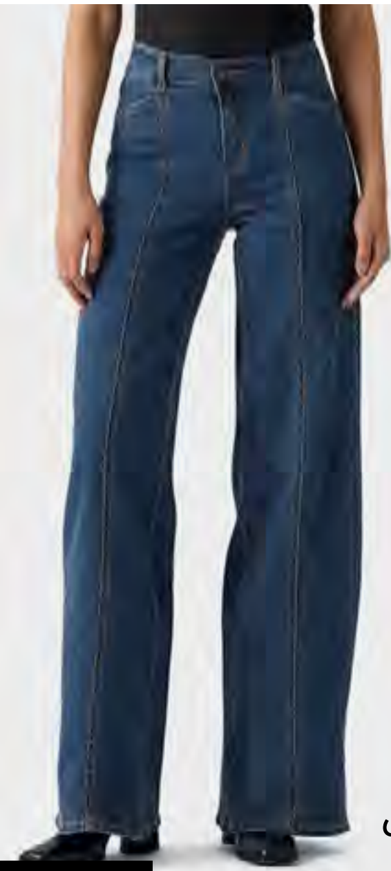
جينز 318 بأرجل واسعة وتفاصيل خياطة AED 499