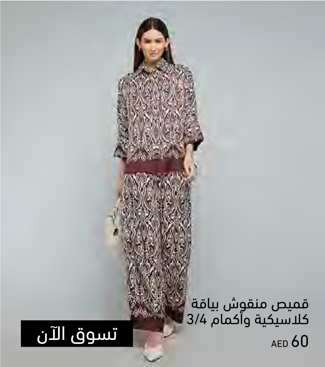
قميص منقوش بياقة كلاسيكية وأكمام 3/4 AED 60