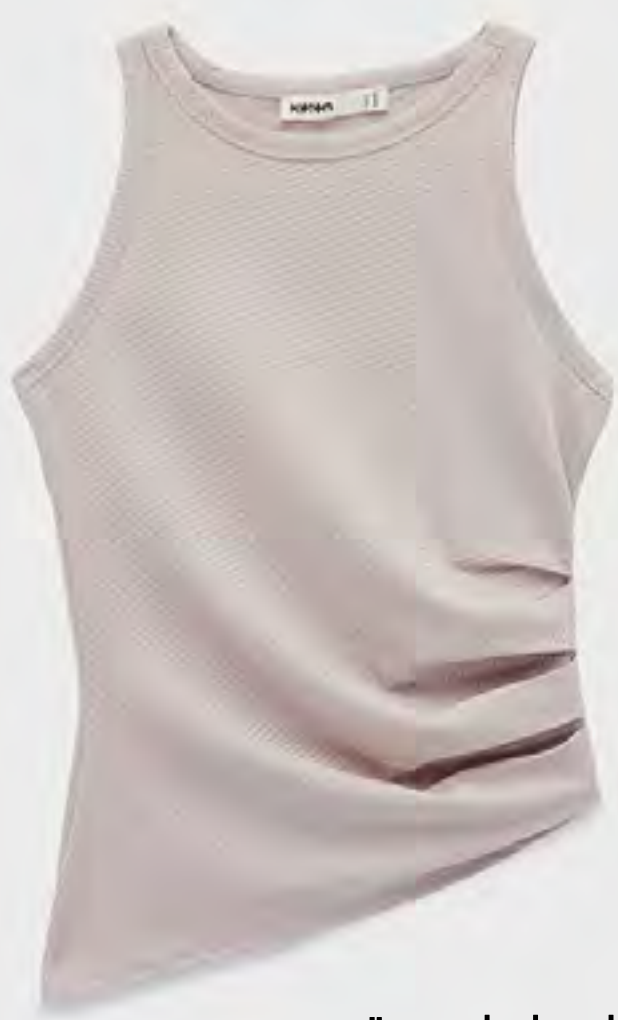
توب مزلع بتفاصيل لامعة وخيوط معدنية