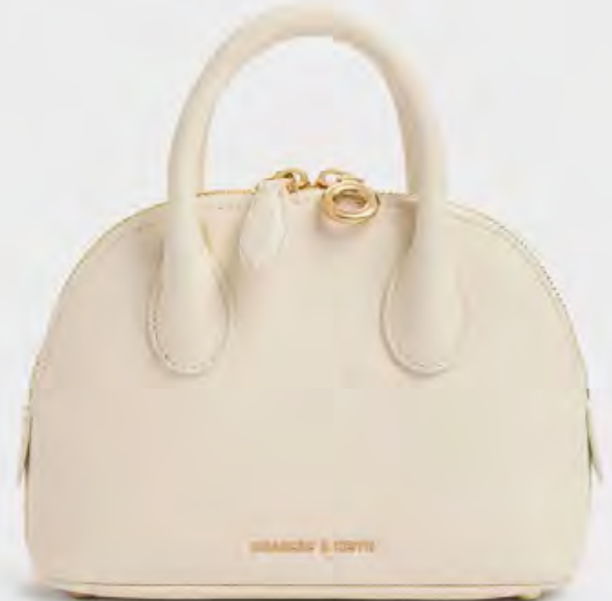
حقيبة بيريل بولينج AED 450