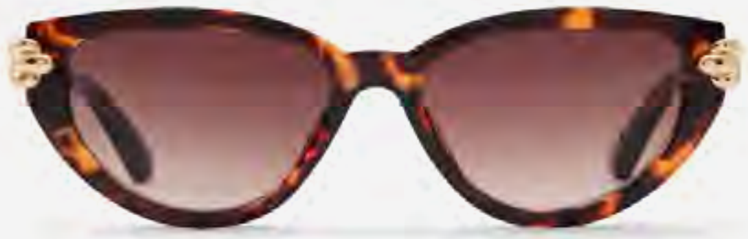
نظارات غايا شمسية ريترو بإطار كامل AED 99