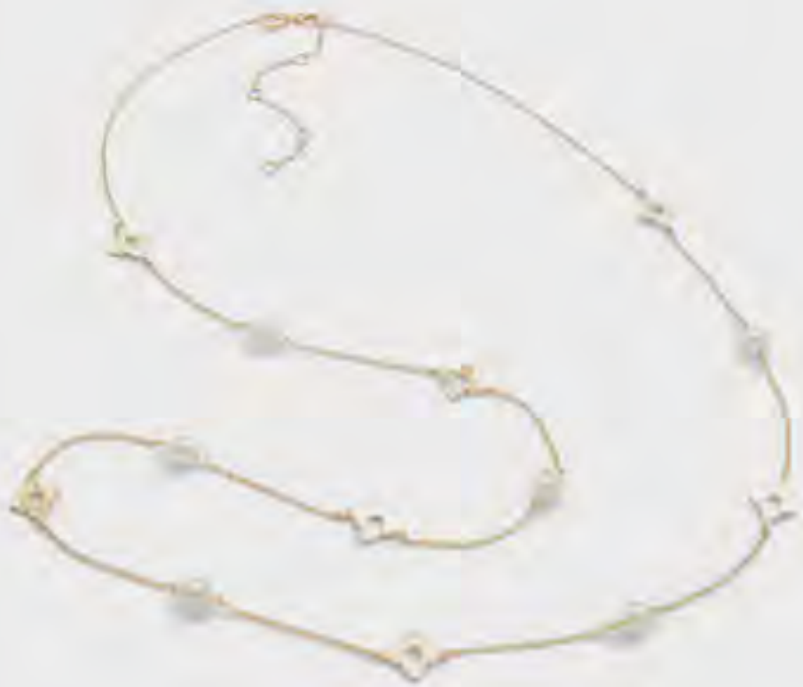
قلادة إيليدندرا مزينة AED 79