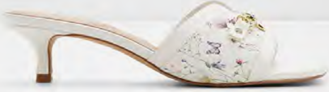
صندل أناماسي بكعب و تفاصيل معدنية AED 399