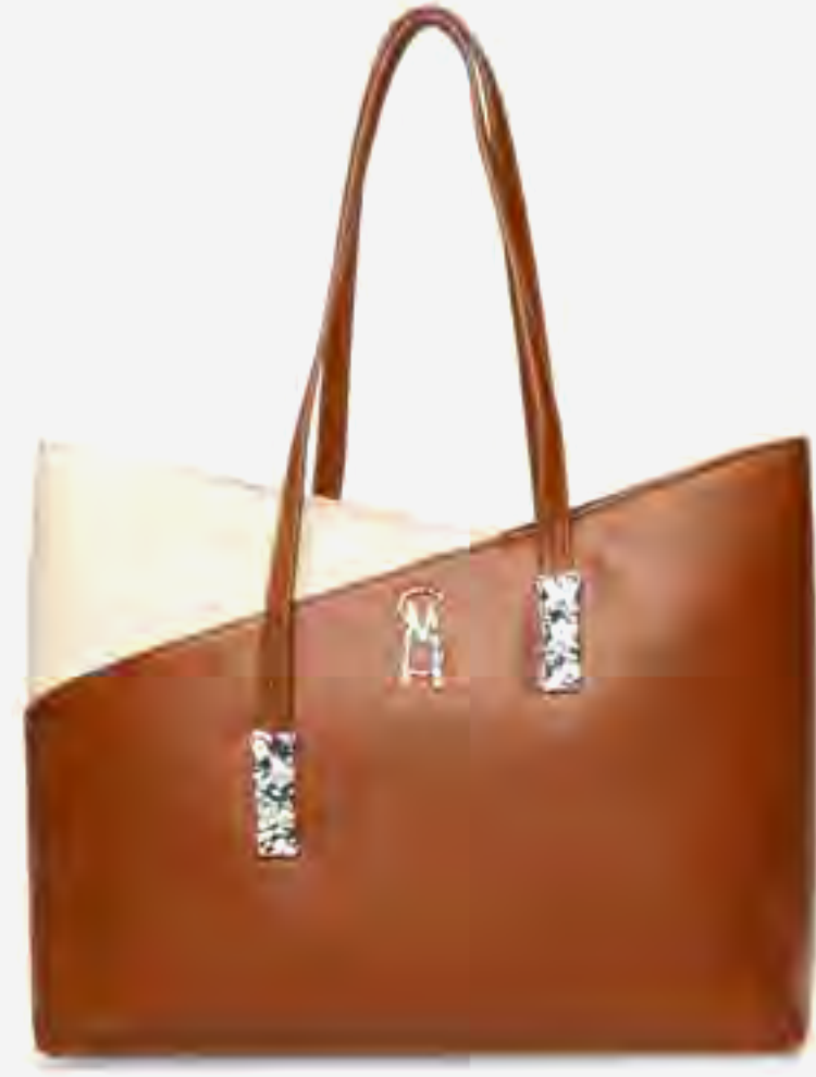
حقيبة بليوت توت ملونة AED 399