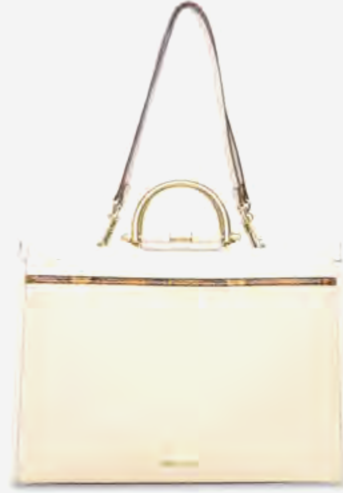
حقيبة بيبريسلي يد محاكاة مع سير طويل AED 499