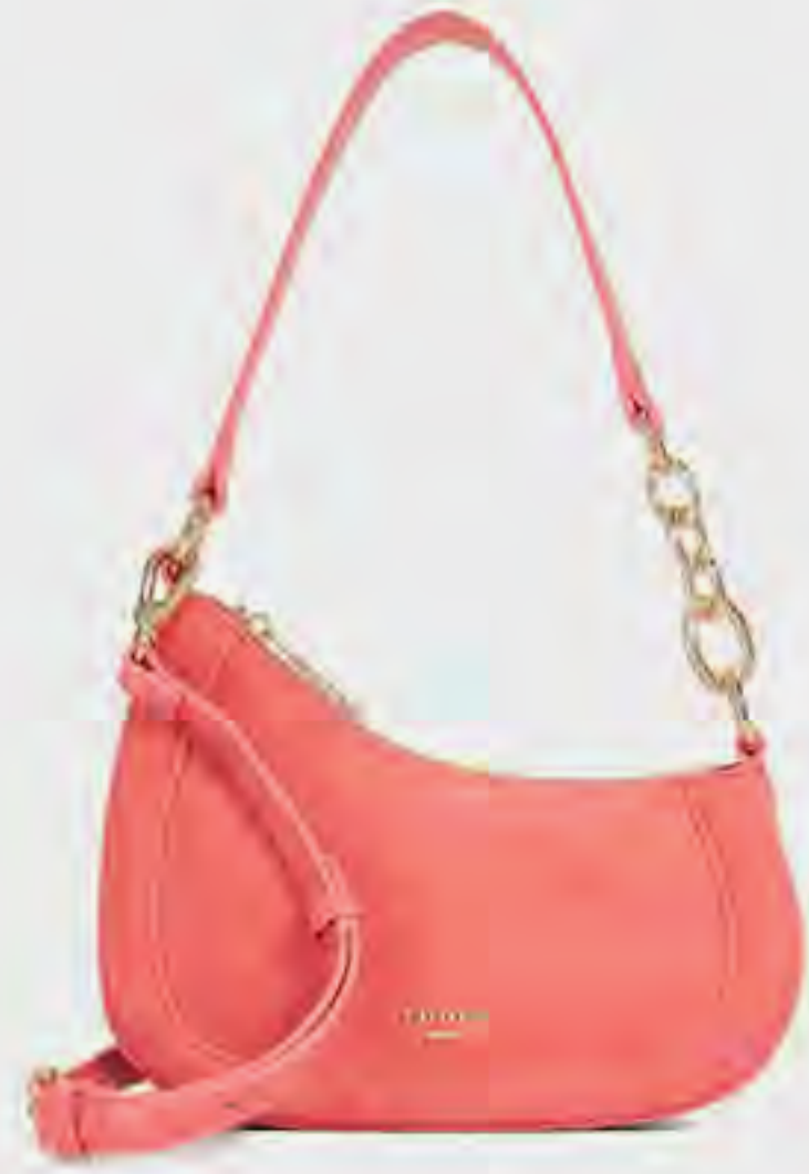
حقيبة دايركشن كتف بتفاصيل الشعار AED 449