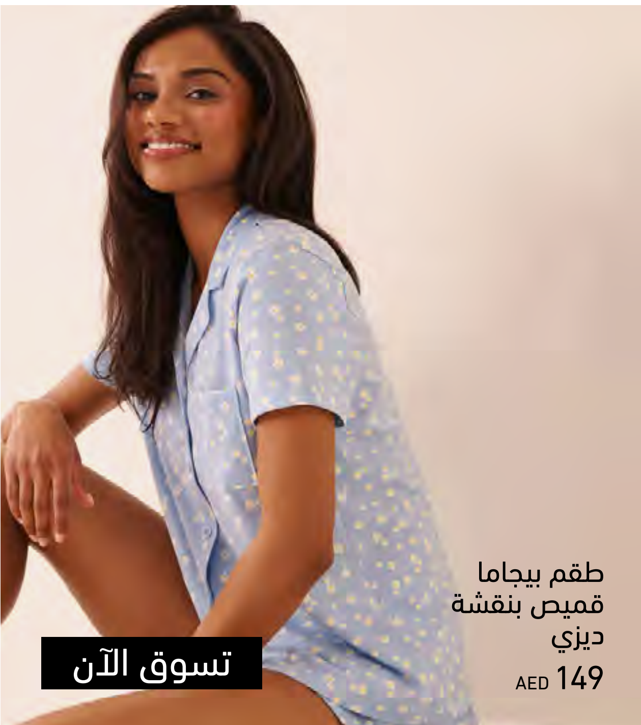
طقم بيجاما قميص بنقشة ديزي AED 149