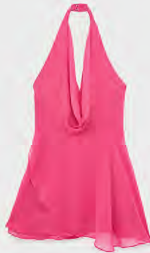
فستان سهرة قصير شيفون بياقة منسدلة