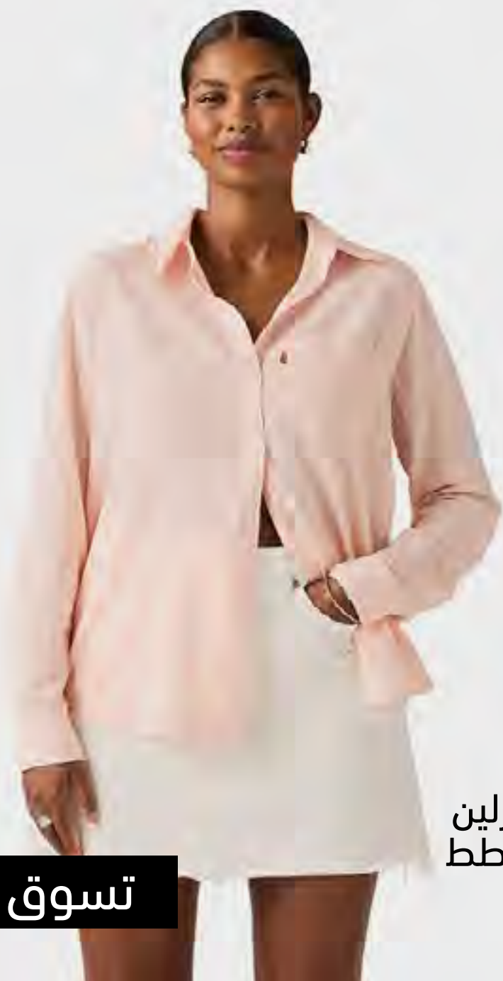
قميص دارلين عملي مخطط AED 399