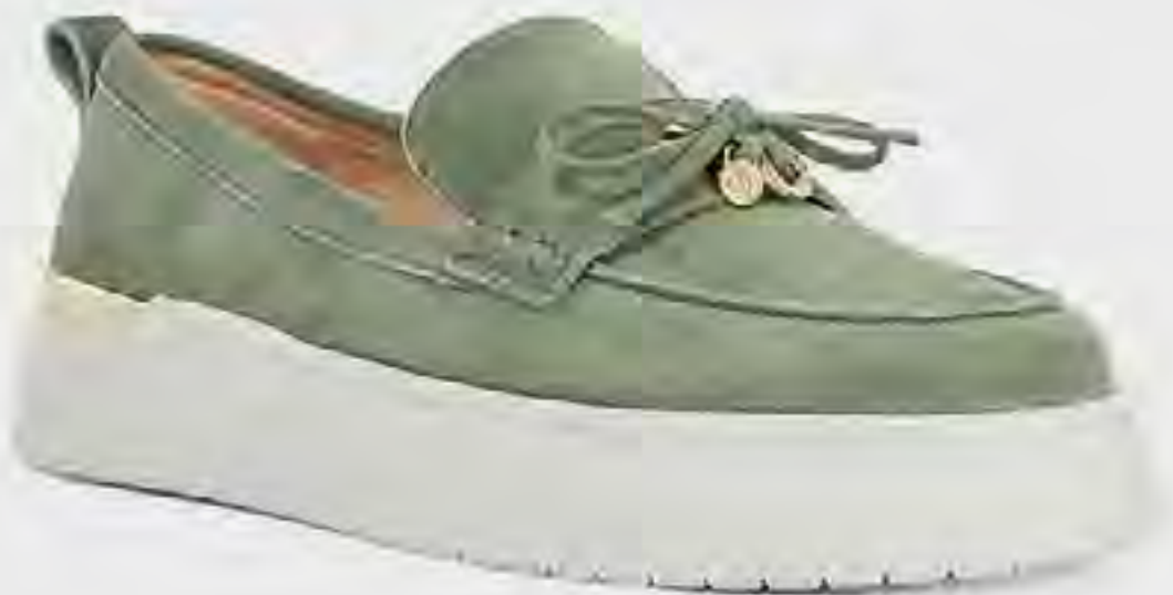
حذاء غلايد لوفر ضخم AED 499