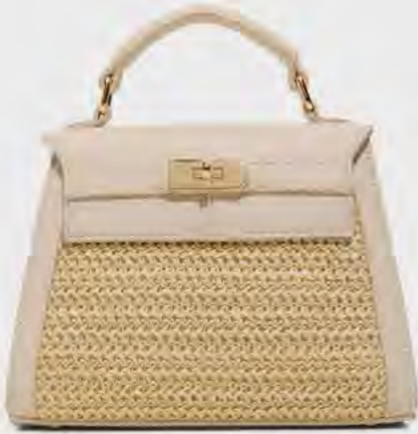
حقيبة ريلي رافيا بمقبض علوي AED 199