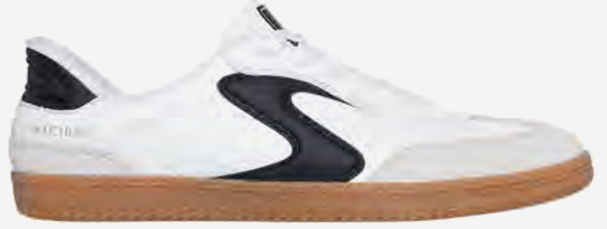
حذاء هوتشوت رياضي برباط AED 429