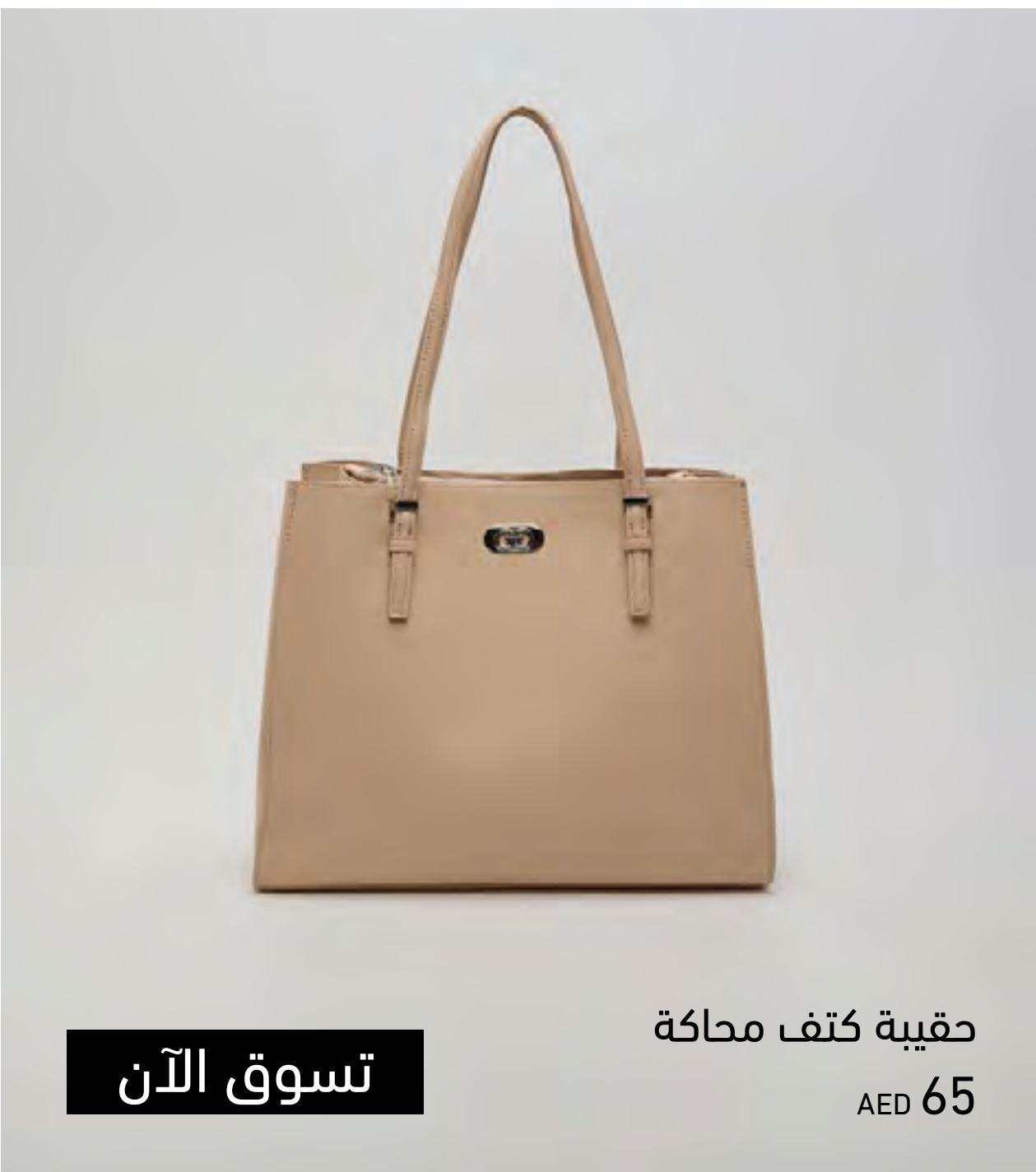
حقيرة كتف محاكة AED 65