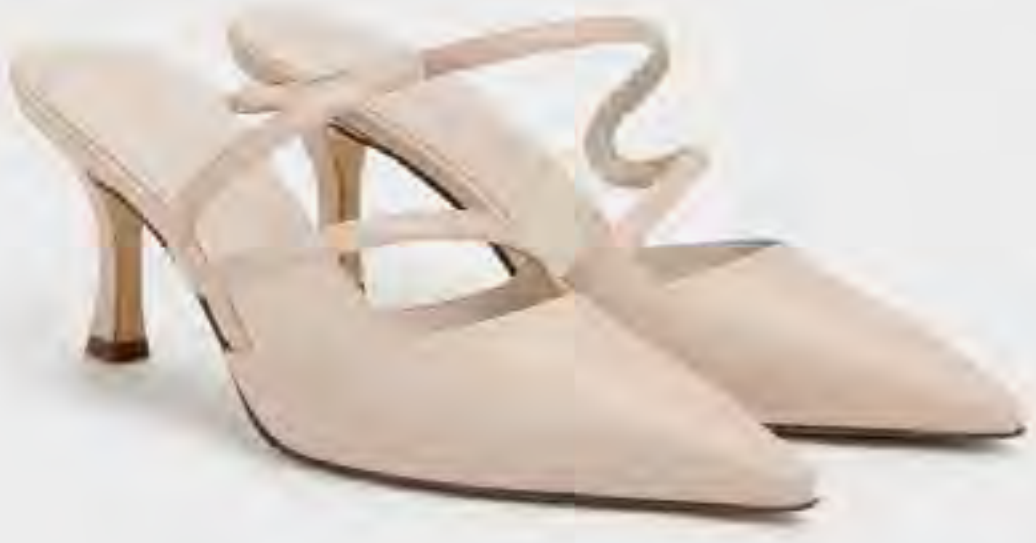
حذاء أردن ميول بكعب مموح ومقدمة مدببة AED 375