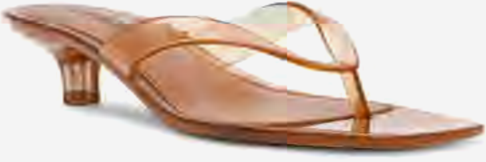
صندل تريسي-جي بكعب ومقدمة مربعة AED 299