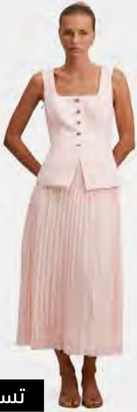
فستان هولسي ماكسي بكسرات AED 629