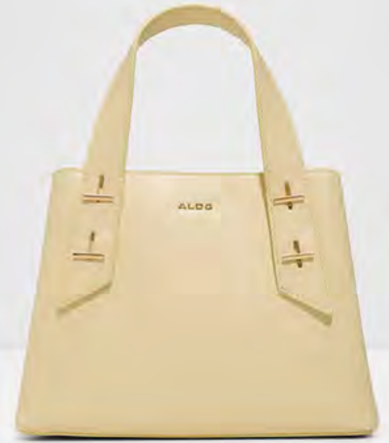
حقيبة زيرينا ساتشيل محاكاة AED 349