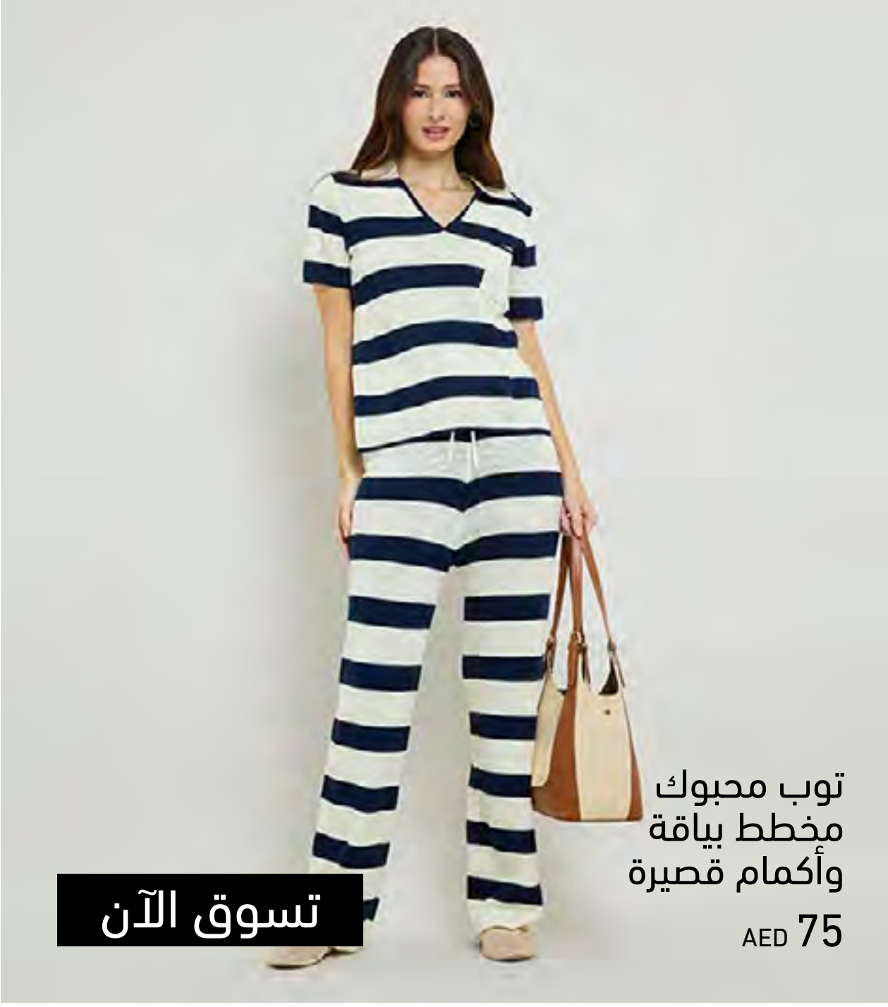
توب محبوب مخطط بياقة وأكمام قصيرة AED 75