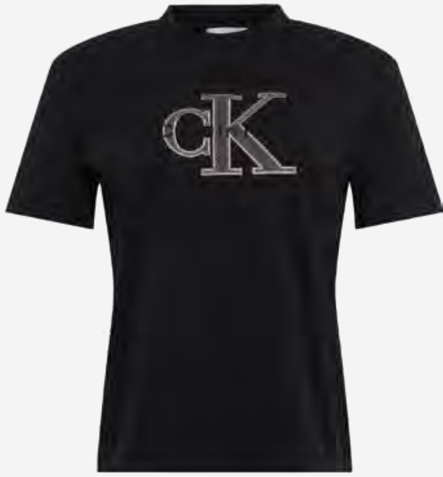
تيشيرت بقبة مستديرة مطرز بشعار AED 350