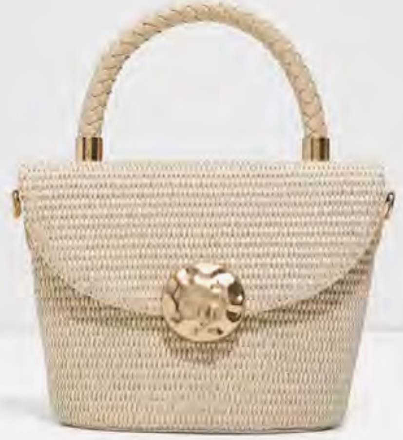
حقيبة سوليتا رافيا بمقبض علوي AED 349