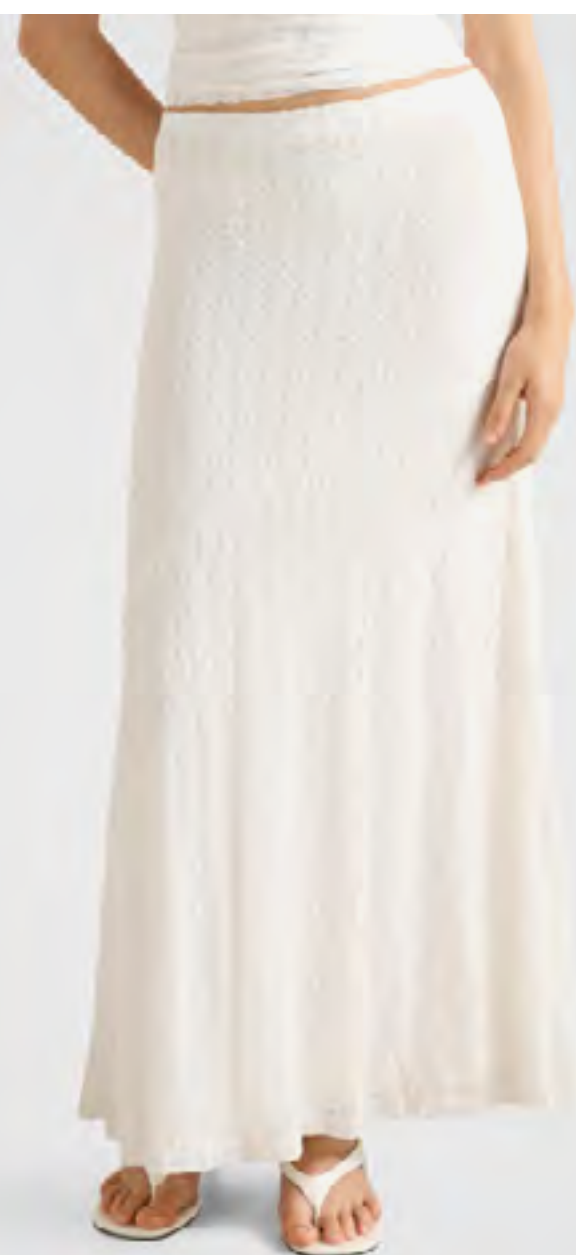
تنورة تاليا ماكسي دانتييل AED 239