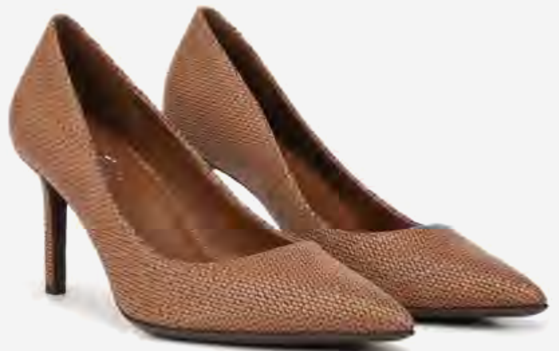
حذاء أنا بكعب ومقدمة مدببة محاك AED 449