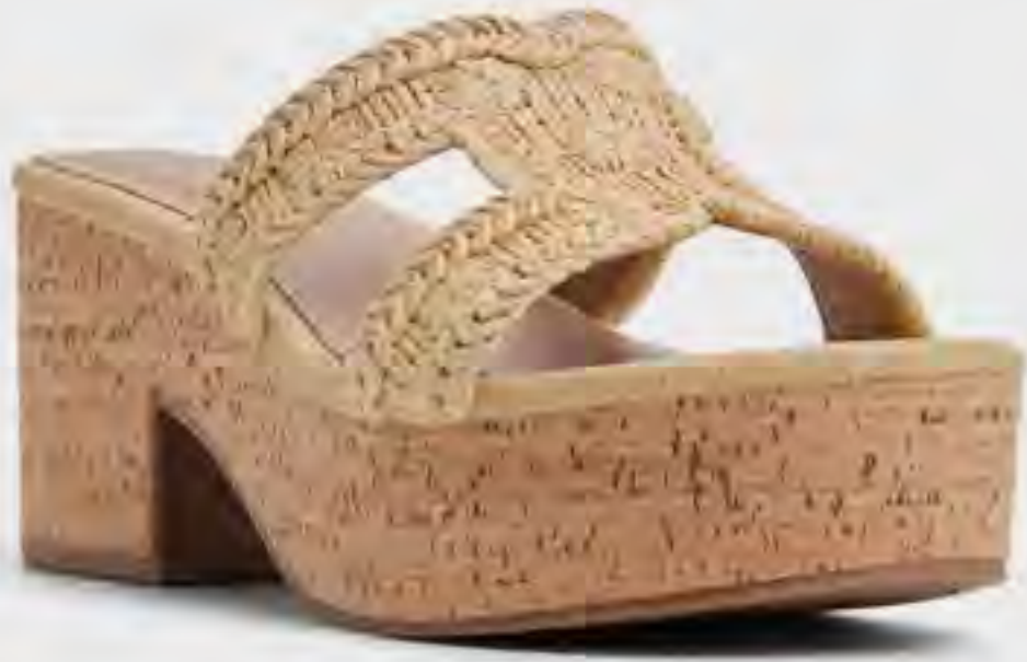
صندل هيليريا وتد مفتوح الأصابع AED 299