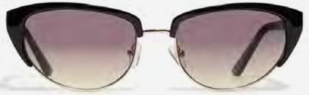
نظارات ليليا شمسية عين القطعة AED 99