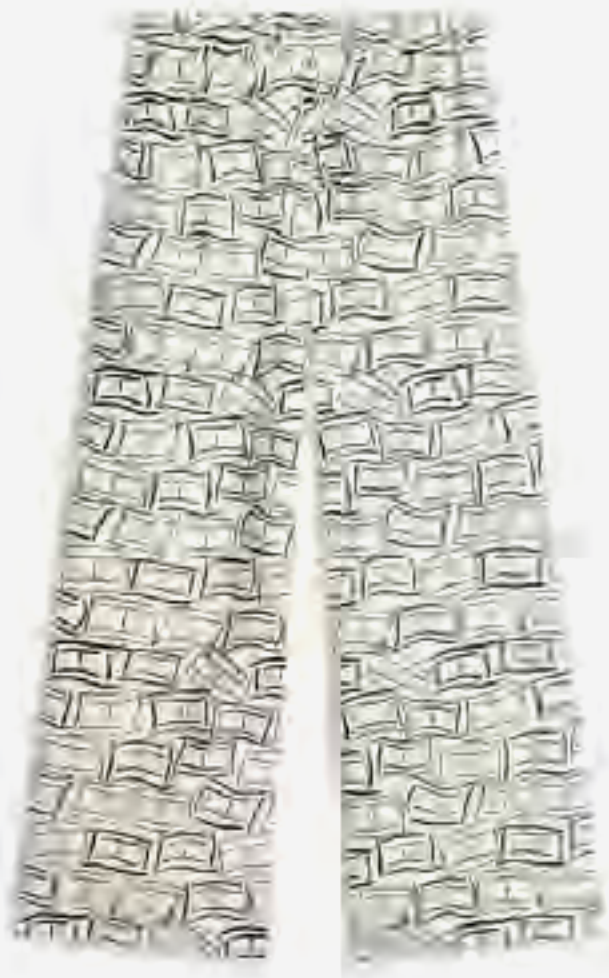
بنطلون واسع من الكتان النقي بقصة مريحة AED 750